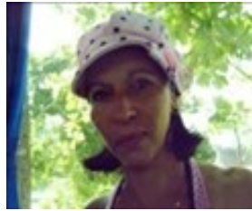
Por: Yamile Bargés Hurtado Periodista Ciudadano

libra al mes y como ya no vemos el pescado, nos dan pollo por pescado 11 onzas, también para todo un mes, lástima que cuando le quitas el pellejo y la grasa, solo puedes comer un día.