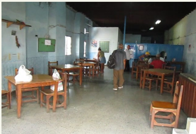
Imagen de uno de los comedores comunitarios

La mayor parte de los ancianos que comen o se llevan el almuerzo, son muy necesitados y no tienen economía suficiente para abastecerse de otros alimentos. Muchos de estos no tienen familia que les socorra y este almuerzo es el sustento para todo el día.