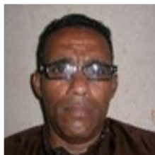
Por: Julio Rojas Portal Periodista Ciudadano

la casa con moretones y marcas de fustas, de no tener una buena rendición de cuentas para no merecerlo, la razón quedaba en el maestro cobrando el castigo una nueva dosis.