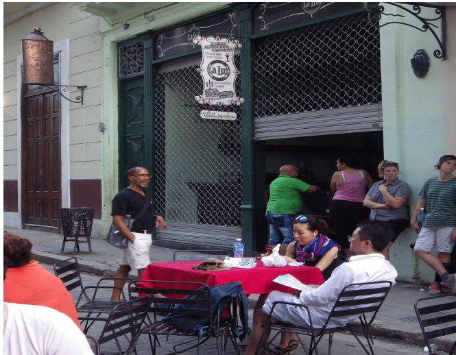
Imagen del Restáurate La Luz

Vieja. Tras ser reparado reabrirá sus puertas en moneda libremente convertible (CUC). La medida afecta a residentes de la zona, trabajadores de establecimientos cercanos y ancianos.