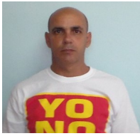
Por: Raúl Velázquez Periodista Ciudadano