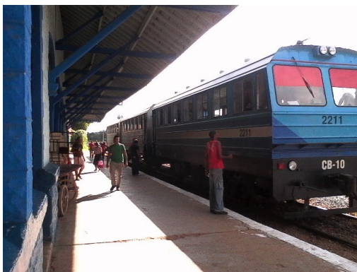
Terminal de Trenes Artemisa,( Tren Tripleta).

Este medio de transporte fue puesto a disposición de la población el 28 de febrero del año en curso. Consta de 3 vagones y tiene dos salidas diarias: 6:00 AM y 11:00 AM.