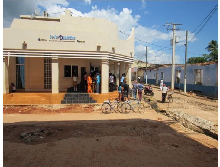
Telepunto de la cabecera provincial, Artemisa. La imagen muestra la multitud esperando poder acceder al local, después de largas esperas.