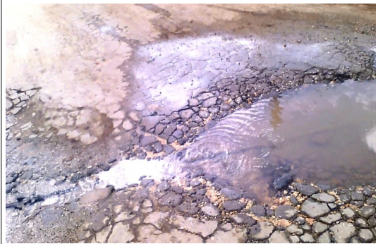
Salidero de agua en una conductora plástica sin solución.

Hasta el momento los pobladores no han recibido respuestas de las autoridades, que desde el inicio del salidero han sido