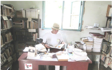
El Director en función de sus actividades

valores humanos, y correctos hábitos en la conducta social de las personas. Realiza concur-