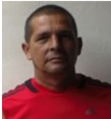
Por: Julio A. Delgado Cubano de Apie

Candelaria, Artemisa (ICLEP). Afectadas familias que reclaman les sean vendidos los productos asignados por la llamada libreta de abastecimiento. La carestía parcial correspondiente a la canasta básica, afectan sensiblemente las mesas de los consumidores. La unidad nombrada "La Fortuna" perteneciente a la empresa de comercio y gastronomía municipal, (red de comercio minorista) se encuentra ubicada en ave-