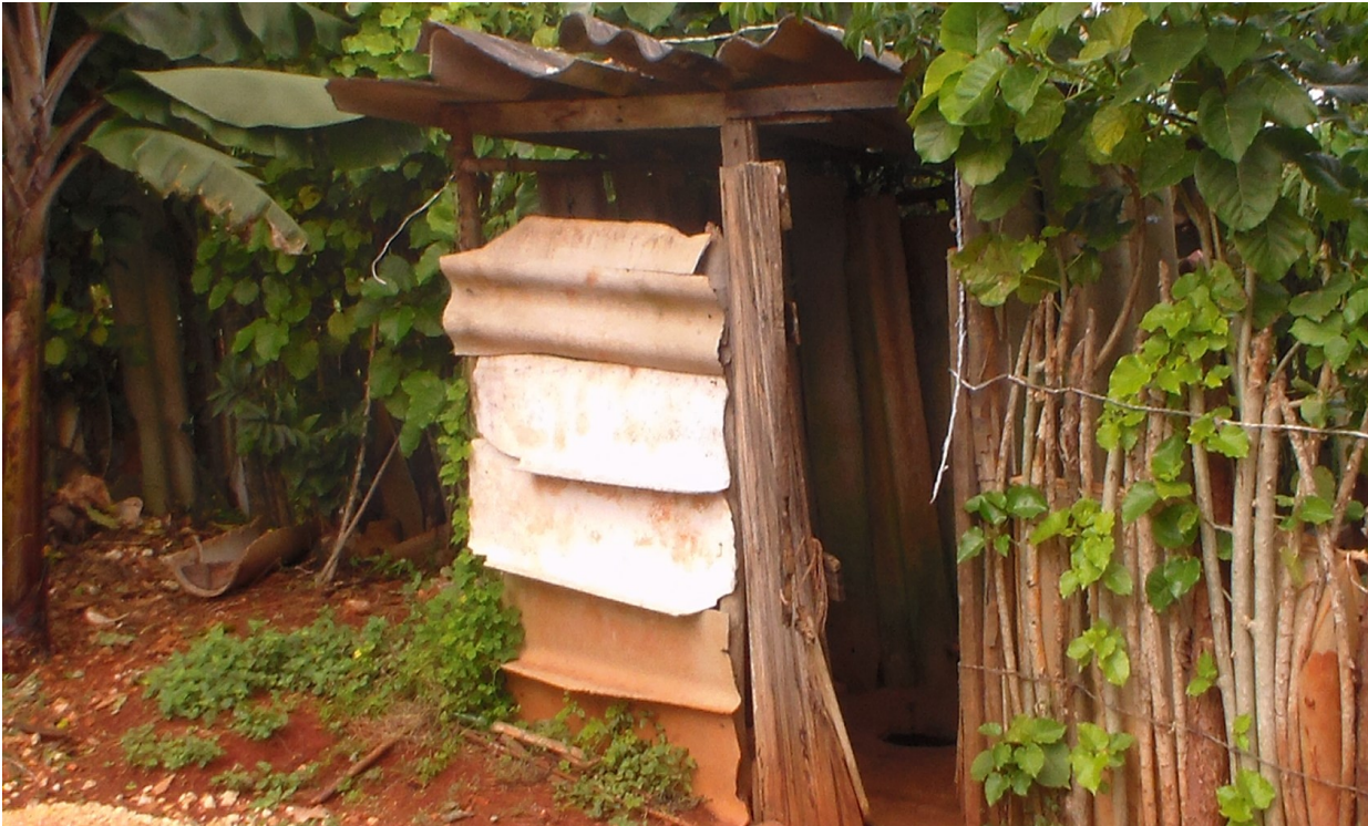
Baño que fue autorizado construir para el ejercicio de las diferentes necesidades fisiológicas y sanitarias. La imagen habla por si sola mostrando las pésimas condiciones higiénicas que presenta el lugar.

¿Qué es lo que tengo? de donde vengo y la esperanza de a donde voy. No iré tan lejos, pues tengo espejo, soy caribeño, soy lo que soy.