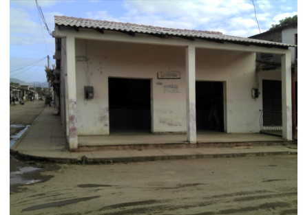
Bodega El escondite

clamos de clientes, groserías que provocan malestar en la comunidad, de quien Yolanda Blanco dijo "Al parecer a nadie le importa nada" y se retira sin el imprescindible arroz para poder comer. El hecho priva a más de 30 núcleos de este comercio a quienes todavía se les debe arroz, azúcar, frijoles y otros productos.