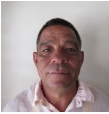
Por: Jorge E. Lazo Periodista Ciudadano