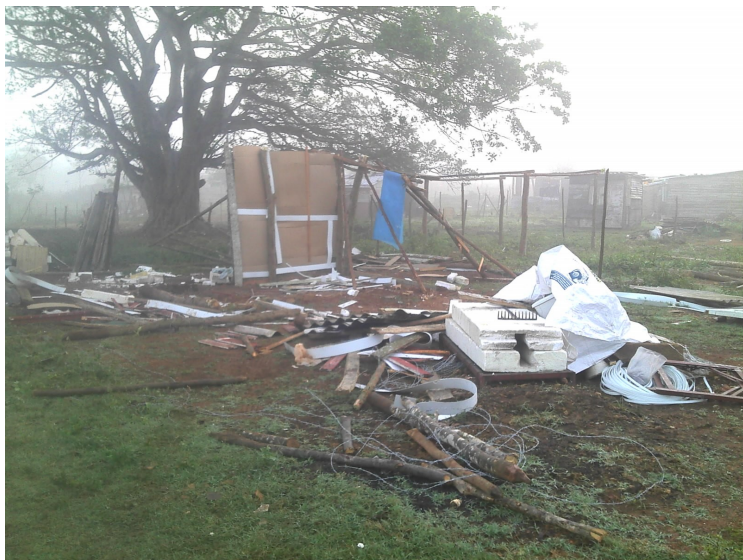
Viviendas derribadas por instancias del gobierno