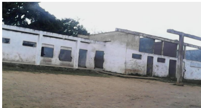
Construcción que puede servir de viviendas

El déficit habitacional que afecta gran parte de las comunidades es reconocido por el gobierno, siendo una posibilidad de ayudar a trabajadores y afectados, la entrega de estos locales abandonados.