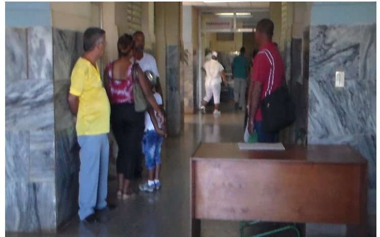
Área de cuerpo de guardia del Hospital