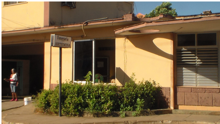
Funeraria del municipio cabecera de la provincia.