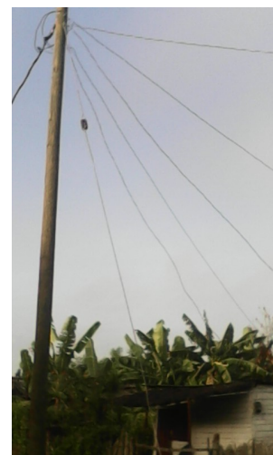
Una de las viviendas que no pudo realizar el pago en tiempo.

El afectado, en el momento de ser notificada su separación, se encontraba convaleciente