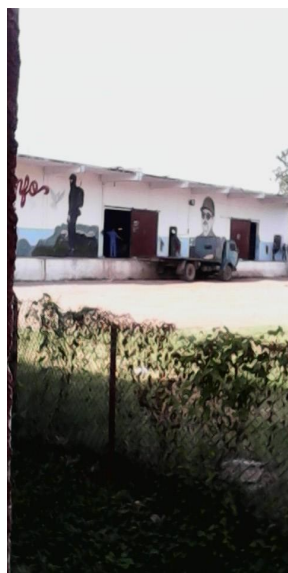
Empresa Mayorista de alimentos 108.