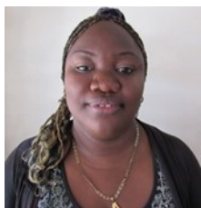
Por: Misleidys Sierra Periodista Ciudadana

Cuando miramos a nuestro alrededor, no importa en que sitio de la isla estemos, la sociedad cubana de hoy sumisa todavía, pero más atrevida, no encuentra la luz al final del túnel; despertando de un largo sueño solo avizora ruinas y manipulación por doquier, donde siempre prima el mismo discurso “ Logros Revolucionarios”.