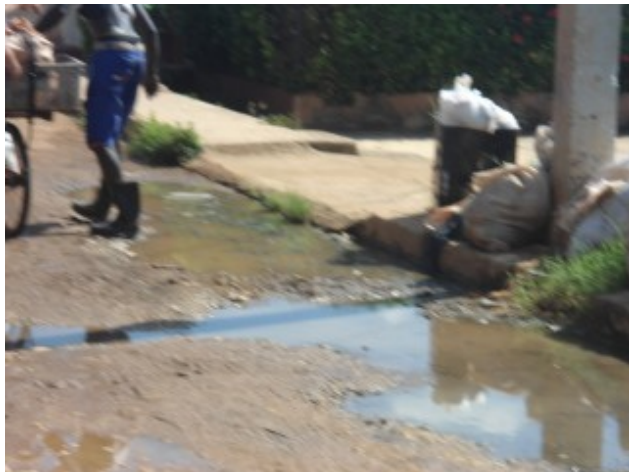
Uno de los desagües de las averías del reparto Pastoritas.

Una joven educadora del centro infantil aledaño, quien pidió el anonimato nos expresó "Todos los días reportamos la incidencia a los puestos de dirección de Higiene, gobierno y educación sobre la situación existente con la insalubridad en la zona y la amenaza que para la salud de los niños bajo nuestro cuidado esto representa, sin embargo es como si estuvieran sordos. Hay padres que han preferido