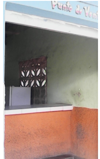
Establecimiento donde se vende cigarro de pésima calidad

"No estamos fumando cigarro ni tenemos conocimiento con qué tipo de material lo están fabricando, el cubano inventa mucho. Nos hemos quejado varias veces a la empresa y la situación sigue cada día mas grave, provocando daños a nuestra salud y a la economía de nuestro bolsillo. A donde vamos a parar" alega la compañera Lazara Alfonso Cordeiro.