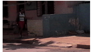
Local de la sede de los CDR