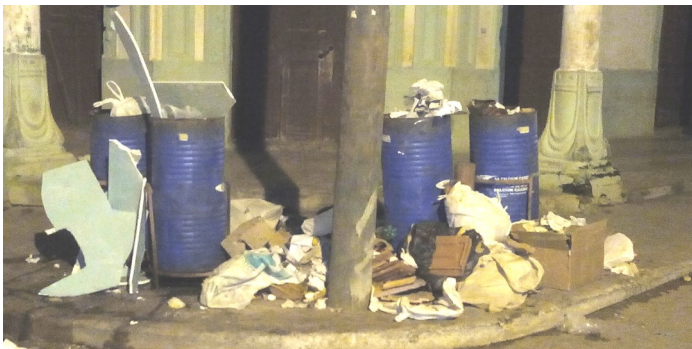
Esquina 29, calle 48

tanto vecinos como trabajadores cuentapropistas situados al fondo y alrededor del micro vertedero, continúan afectados por la fetidez y mosquito que desprende el antihigiénico