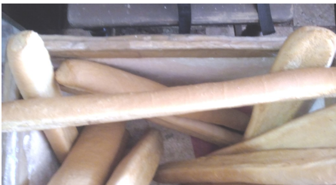
Muestra de las flautas de pan

Esta panadería es la más concurrida por clientes, debido que está ubicada en el centro de la ciudad, área muy concurrida y donde se encuentran los mayores comercios tanto privados como estatales, por lo que sería de beneplácito que retomen la senda de la calidad y de forma estable, eso es lo que quieren las familias artemiseñas.