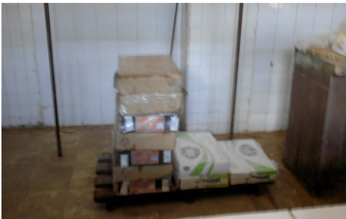
Área de la carnicería del mercado ideal, muestra las cajas de pollo, picadillo y perro caliente, fuera de congelación.

Sin embargo, lo cierto es que aun así, el hecho constituye un maltrato al pueblo si tomamos en cuenta que Artemisa tiene una población que supera los 46.000 habitantes en su casco urbano y más de 82.000 en el municipio y si a esto le sumamos la triste realidad de que el salario promedio del trabajador cubano no se acerca mínimamente a la suma de 600.00 pesos moneda nacional, ¿Entonces por qué vender el pollo por caja?, esta es la pregunta que el pueblo pide sea respondidas por las autoridades de la zona.