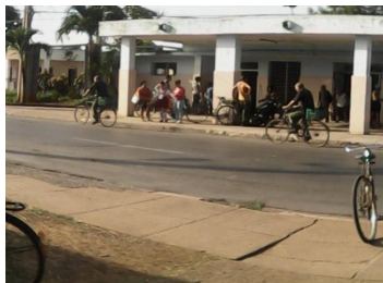
Entrada del Policlínico Gilberto Marquetti