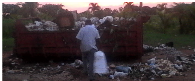
Contenedor destinado a almacenar la basura