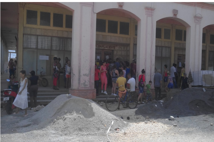
Tienda de artículos en moneda nacional. La Complaciente