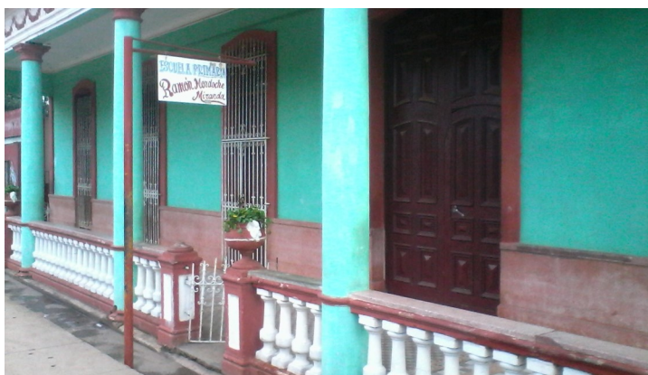
Escuela primaria Ramón Mordoche Miranda