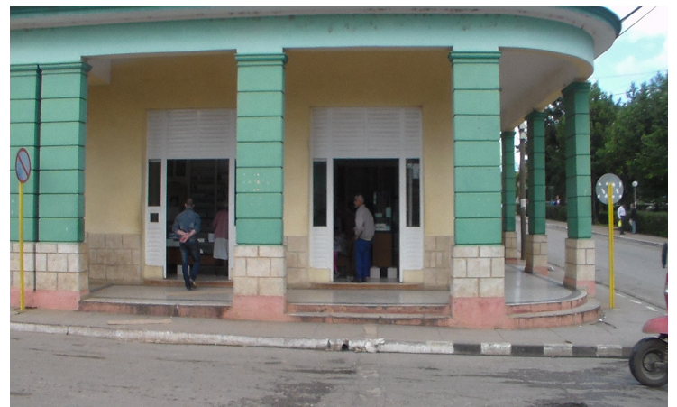
Farmacia Piloto.