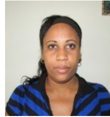
Por: Yudania Pluma Periodista ciudadano