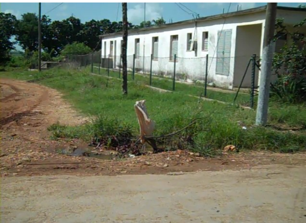
Avería en la tubería de agua, que aún no ha sido solucionada