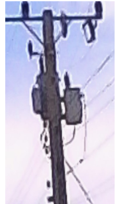
Transformador con dificultades para abastecer el fluido eléctrico

El temor de la ciudadana demandante, es que ya la delegada había manifestado que en Enero del presente año se le daría solución al grave problema que aún hoy persiste.