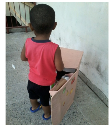
Juguetes de cartón para todos los días