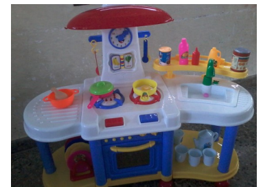
Juguetes utilizados solo cuando hay visitas