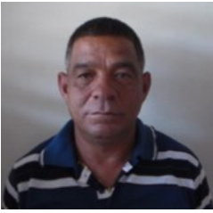
Por: Jorge E. Lazo Periodista Ciudadano