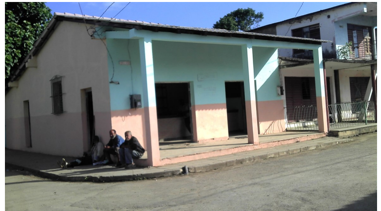
Unas de las bodegas en que son vendidos los yogurt en mal estado

cuentran cerradas, depositándolos en los portales, bajo el sol, esperando hasta que abran las mismas por la tarde a las 2:45pm.