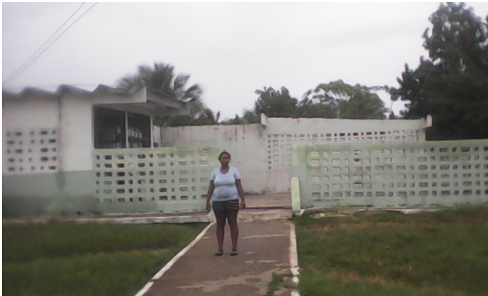
Lo que un día fue Circulo Social en Modesto Serrano