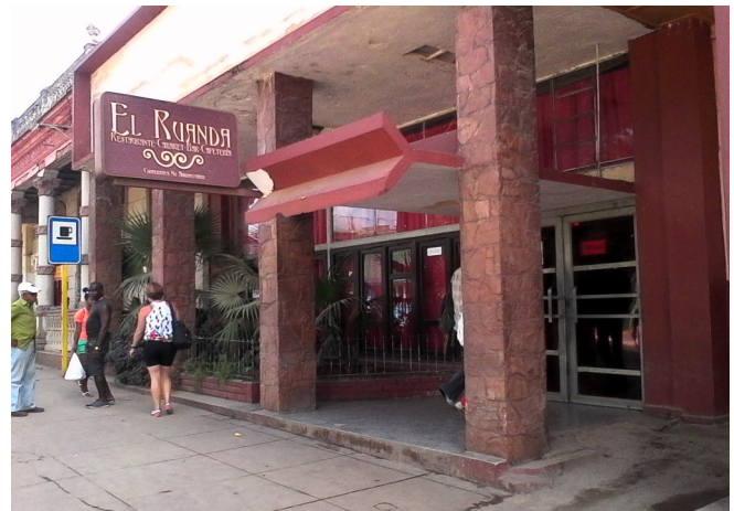
Cabaret restaurante "El Ruanda"