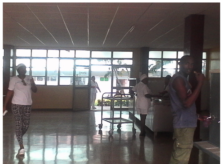
Área de elaboración de alimentos del Hospital Ciró Redondo García

“Mi trabajo es elaborar los alimentos, cocino lo que me sacan del almacén, no tengo nada que ver con el menú del día, eso es problema del almacenero. Todo el mundo se queja, pero, nosotros que trabajamos en la cocina tenemos que comer la misma que ellos”. Palabras de una cocinera que no quiso ser identificada.