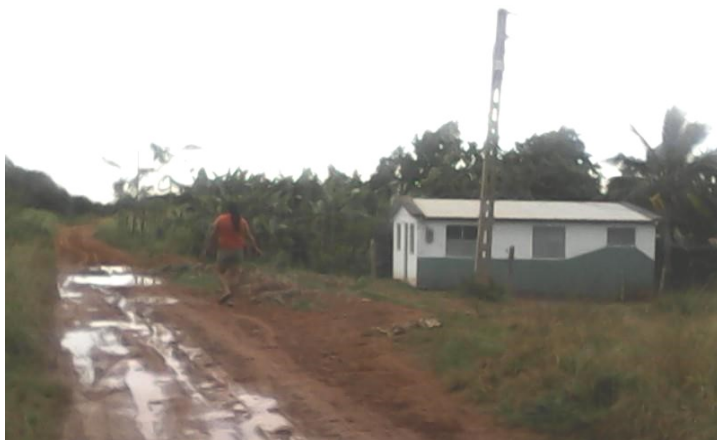
Vía de enlace del poblado Modesto Serrano a la ciudad cabecera

Debido a las quejas que ha dado la población poncharon algunos lugares pero aun así continua igual. "Por qué si hay presupuesto para hacer las fiestas populares, no lo hay para reconstruir la carretera" terminó expresando Olga.