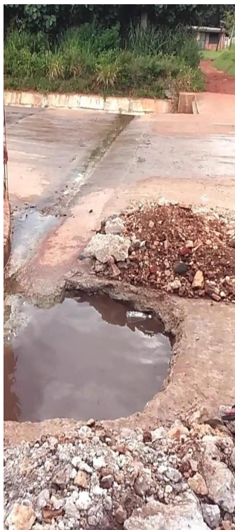
Hoyo olvidado por las autoridades pertinentes