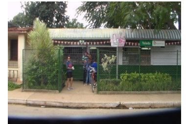
Kiosco de Toledo