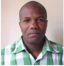
Por: Alberto Castaño Periodista Ciudadano