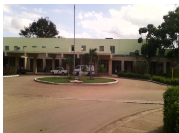
Hospital "Ciro Redondo García"