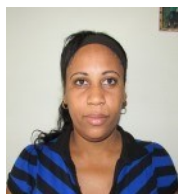
Por: Yudania Pluma Periodista Ciudadano