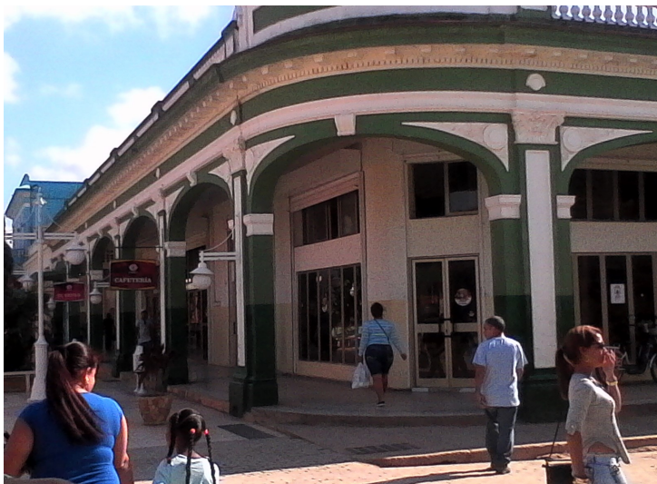
" Cafetería Café Cubita" entidad recién inaugurada