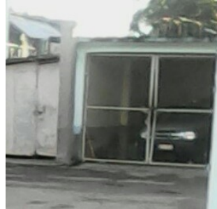
El único carro con que cuenta la funeraria, y se encuentra roto

desde hace cinco meses en que el carro de dicha funeraria sufrió un accidente. Comenzaron a recibir apoyo desde el vecino municipio Candelaria pero este también se encuentra roto desde hace tres meses, debiéndose recurrir para estos servicios desde Artemisa y Bauta, solución que provoca demoras y protestas de los dolientes.