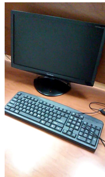
Una de las maquinas fuera de uso

Realmente, las empleadas del sitio prestan buen servicio, el problema consiste en el paquete tecnológico de esta empresa, una de las más poderosas del país, que se ha visto incapacitada de solucionar las averías y capacidad de conexión, además de poder extender y profundizar sus servicios. “Es una odisea, la conectividad es inestable, no puedo configurar el correo nauta en mi celular, se pasa trabajo para conectarse a internet, y para desconectarse es otro dolor de cabezas, sin embargo el gasto corre, ¿Acaso no es esto un robo al pueblo?”, manifestó Doris, una de las tantas internautas afectadas.