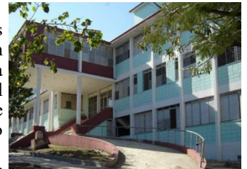
Hospital Gustavo Aldereguía Lima, de Cienfuegos

En casos graves, la enfermedad puede causar la muerte. Los niños pueden tener síntomas como anemia grave, llegando incluso a afectar el cerebro. En los adultos también es frecuente la afectación multiorgánica