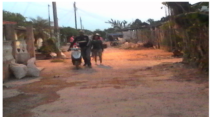
Vía de acceso convertidas en terraplenes

Esta situación se publicó en la edición # 20 con el título: "Desvían Presupuesto" y hasta la fecha no han resuelto el problema que a muchas personas les ha afectado fundamentalmente en la salud, padeciendo actualmente de alergias desconocidas.