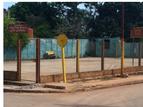
Área deportiva del poblado Las Cañas

Los medios de comunicación se hacen eco de los buenos hábitos y recreación saludables, resultaría positivo también si intercedieran ante las autoridades deportivas para la reactivación de esta una importante y única opción de su tipo en la localidad.