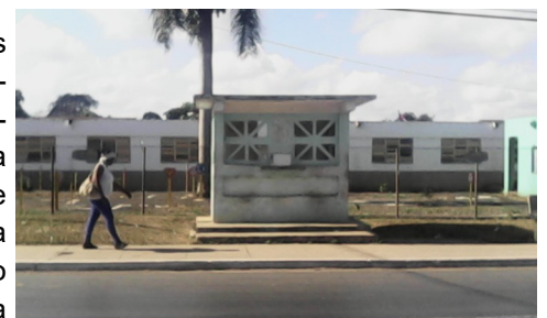
Estanquillo, al fondo escuela primaria

El medio de comunicación comunitario El Majadero de Artemisa, publicó en la edición 21 del año 2016 la nota bajo el título "De qué sanidad Hablamos", sin que hasta la fecha las autoridades competentes <<Salud pública, inspectores, correos de cuba y gobierno>> se hayan interesado en la solución del problema, que afecta el ornato público y medioambiental de la ciudad.