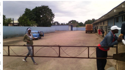
Terminal provincial

Tan antigua y reconocida como su inversa, la ruta 35, que enlaza la provincia Artemisa con la capital del país, también existe el enlace entre Artemisa y San José de las Lajas, cabecera provincial de Mayabeque, entonces ¿Por qué no reactivar la ruta 53 y enlazar a Artemisa con Pinar del Rio por carretera? Ambas provincias tienen un gran flujo de pasajeros que se ven seriamente afectados por la discriminatoria medida.