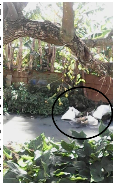
Conducto tupido de desechos

“Esto viene sucediendo hace más de cinco años y nadie toma conciencia del peligro que esto representa para todos. Las autoridades y el delegado deben tomar cartas en el asunto y no continuar permitiendo tales desordenes que favorecen la presencia de roedores y propagación de enfermedades contagiosas” concluyó la fuente.