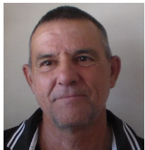
Por: Armando Lara Cubano de a pie

¡Elija que desea seguir siendo usted!, y recuerde, puede cambiar para bien, como seres humanos podemos equivocarnos, pero tenemos que aprender a rectificar, usted tiene la oportunidad de ser diferente, correcto y ayudar a su pueblo, no deje que otros tomen su alma o decidan por usted, mucho menos permita que otros planifiquen su vida y lo priven de elegir e incursionar por su propio destino.