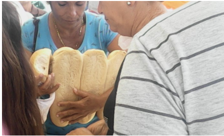
Habitantes adquiriendo el pan

día 9 de abril, siendo las nueve y media de la mañana, varios clientes esperaban desesperados por el atraso ocasionado en el horario de apertura para la venta del alimento, que también tuvieron que llevarlo bajo de peso por motivos poco convincentes.