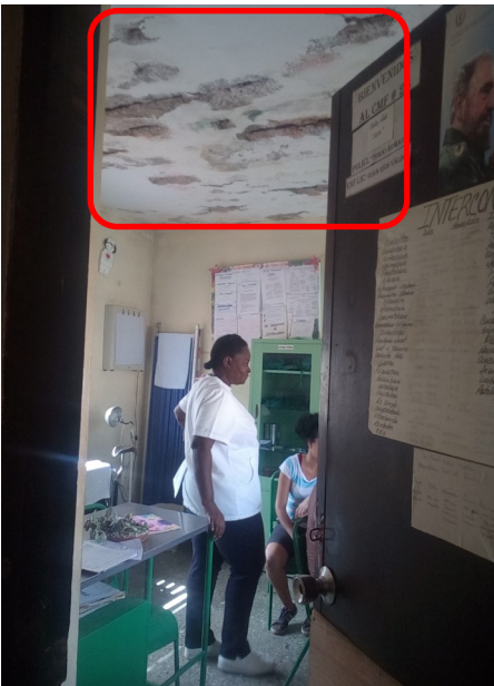
Área de consulta del consultorio Toledo