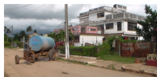
Círculo infantil "Mi Carrusel" (Foto de archivo)

El círculo cuenta con una matrícula de 173 niños, si a cada uno se le rebaja 3 onzas y encima de todo, el alimento es adulterado (se le agrega agua) ¿Qué alimentación se les está proporcionando a estos infantes, en una etapa en que el mismo es fundamental para su desarrollo? ¿A dónde van a parar las onzas que se les rebaja a los alimentos? ¿La estafa ocurrirá solo con los alimentos líquidos o con todos? Otra cosa no se puede pensar, concluyó Lidia.