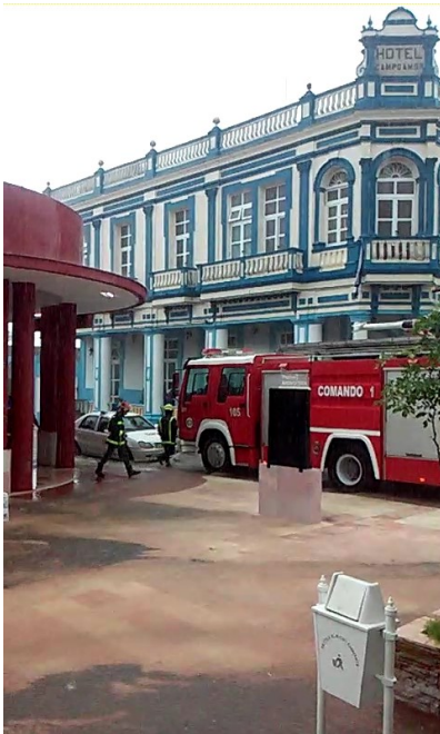
Bomberos en el momento que hicieron acto de presencia