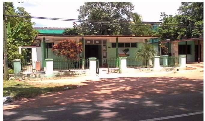
Bacteriológico del municipio cabecera (foto de archivo)

El caso que nos ocupó esta edición, no es un caso aislado, existen infinitos de ellos.