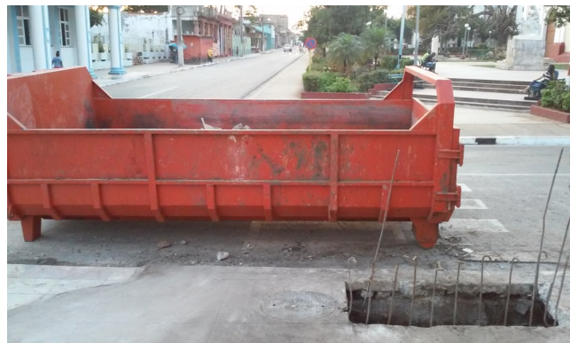
Contenedor usado en la destupición de los canales subterráneos

Este hueco abierto se encuentra en la calle 27 esquina a calle 50 (El Boulevard), igual proceder ocurrió con un tramo de la misma acera abierto en el costado del Coppelia, calle abajo, ambos con el objetivo de limpiar como lo hicieron y sacaron bastante desecho acumulado. Aún cuando ya fueron tapados, hay que esperar para ver si el trabajo que le realizaron es efectivo ante el embate de las lluvias.