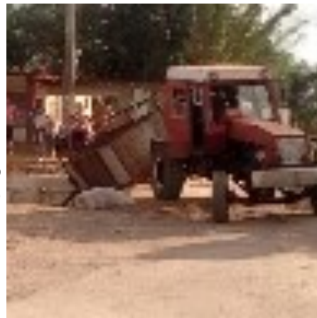
Vehículo que sufrió accidente producto al mini vertedero

El pasado día 20 de abril ocurrió un accidente con un tractor que al transitar por la calle se tropezó con los sacos de basura y la carreta fue a parar al canal. Aunque no hubo ningún lesionado no deja de alar-