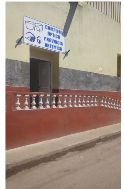
Complejo óptico provincial

“Esta situación constituye una falta de respeto hacia la población. ¿Cuánto más tendré que esperar para adquirir mis lentes?” concluyó Rolando.