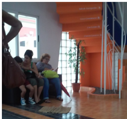
Área de recepción de las oficinas de ETECSA

alta demanda de los servicios. ¿Por qué no habilitar la máquina rota en la planta baja y otro local alternativo para mejorar los servicios?, concluyó la afectada sin querer dar su nombre.