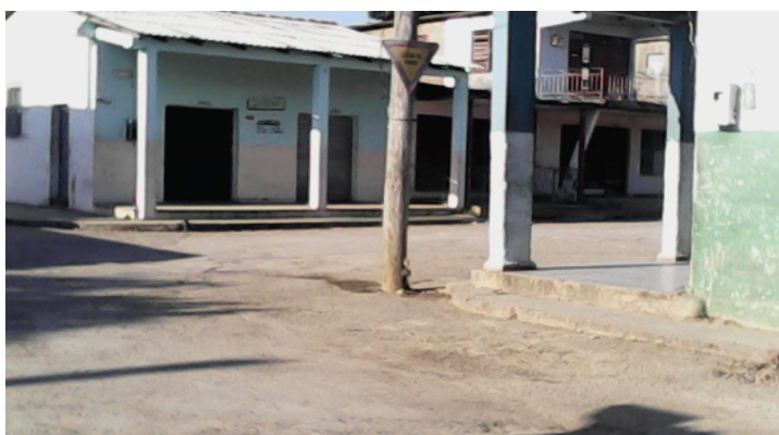
Bodega "La Fortuna"