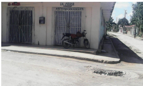
Uno de los huecos frente a la bodega