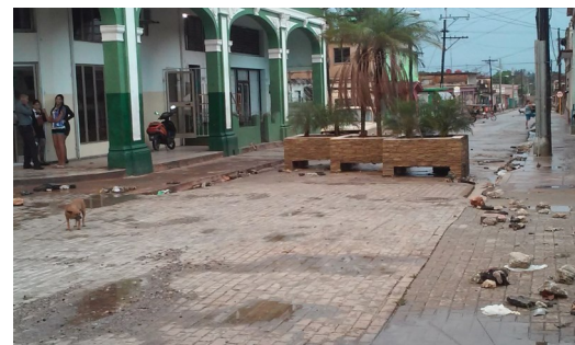
Estado en que queda el Boulevard después de las lluvias

La obra aún sin terminar, tiene un alto costo económico en beneficio y también según se percibe, en perjuicio. Artemisa, ha acometido <después de pasar a ser provincia y capital de la misma en el año 2011> varias obras sociales de sumo interés, como es el caso de la avenida 40 a casi todo el