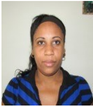
Por: Yudania Pluma Periodista Ciudadana