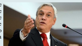
Sebastián Piñera

"Haremos todo lo que esté a nuestro alcance para colaborar con otros para que se encuentre una salida a la violencia, a la represión y para que se restablezca plenamente el orden constitucional y democrático", acotó.