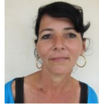
Por: María D. Miranda Periodista Ciudadano

“Hasta cuándo vamos a ser víctimas de la falta de respeto en este centro asistencial, si los médicos hubieran contado con un tomógrafo funcionando en el hospital mi esposo hubiera sido atendido con rapidez y Quizás hubiere existido otro final, no tan triste para la familia” concluyó Magalis.