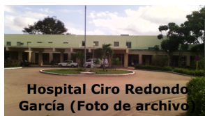
Hospital Ciro Redondo García

“Él no se murió, tú lo mataste, lo sedaste y luego te acostaste a dormir. ¿Cómo es posible que poco antes nos digas que mi esposo no tiene nada y ahora está muerto?”, fueron algunas de las palabras expresadas por Eunice Medina en su desesperación.