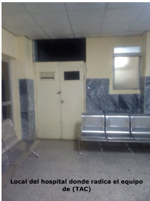
Local del hospital donde radica el equipo de (TAC)