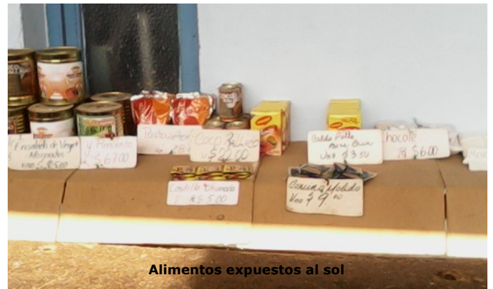
Alimentos expuestos al sol