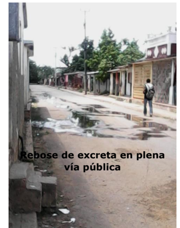
Rebose de excreta en plena vía pública

Las autoridades conocen que en el sitio residen ancianos, juegan niños en la calle, madres recién paridas, en fin, seres humanos todos que necesitan ser atendidos a tiempo antes de que ocurran males mayores.