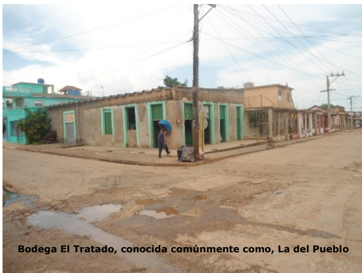
Bodega El Tratado, conocida comúnmente como, La del Pueblo

En la edición 34 correspondiente al mes de octubre del año 2016, quedó expuesta la preocupación de los consumidores en una publicación aparecida en el medio de comunicación comunitario El Majadero de Artemisa, sin embargo después de ocho meses transcurridos no aparece aún una solución.