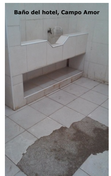
Baño del hotel, Campo Amor

Se pudo conocer que como iniciativa se prestan servicios de cabaret los viernes en el horario de 11 de la noche hasta las 1 y 30 de la madrugada. Artistas y humoristas de la localidad amenizan esta nueva oferta que tiene como precios 60 pesos en moneda nacional la entrada, excesivamente elevado comparado con los centros recreativos de mayor calidad.