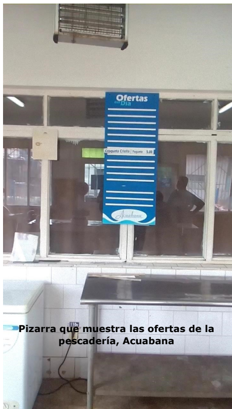
Pizarra que muestra las ofertas de la pescadería, Acuabana