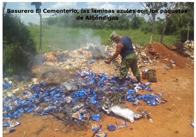
Basurero El Cementerio, las laminas azules son los paquetes de Albóndigas

Otro señor que no quiso identificarse, se encontraba en el lugar recopilando algunos paquetes de las Albóndigas y manifestó: “Mira esto todavía sirve para comer, están congeladas. Si no la van a vender que las regalen al pueblo, a los más necesitados y no le echen petróleo para quemarlas” concluyó.