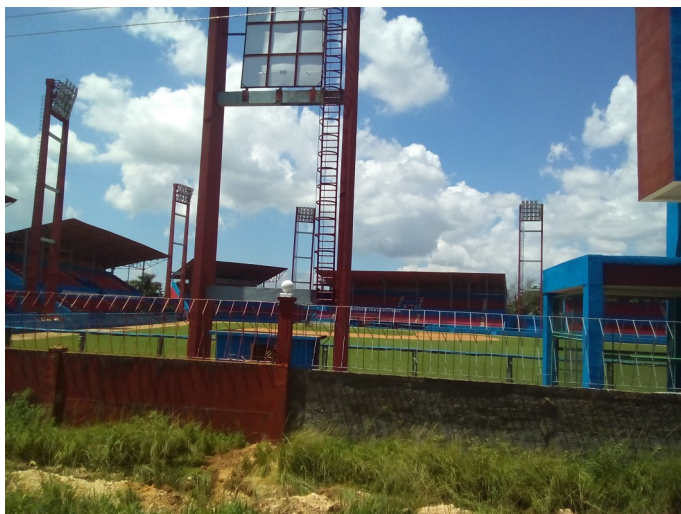
Estadio Veinte y seis de Julio

“El estreno no pudo ser mejor, ocho por dos ganó Artemisa a Cienfuegos en partido correspondiente a la serie nacional de beisbol. También se efectúan en el estadio partidos de la serie provincial del deporte, donde el equipo de mayores ha aportado varios jugadores a las selecciones nacionales que han sido puntales en diferentes competiciones” manifestó Sito, conocedor de este deporte.