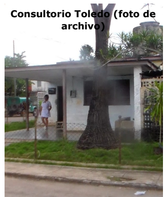
Consultorio Toledo