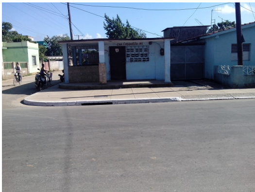
CNA Coppelita N° 1, establecimiento cerrado