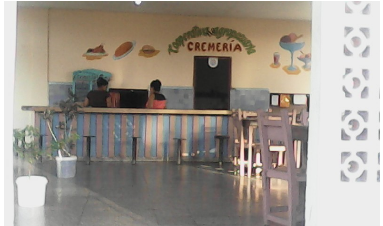
Unidad gastronómica, Cremería