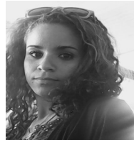
Por: Yoarielis Centelles Periodista Ciudadano

En el momento que Sánchez Cordero acudió al policlínico, había en igual situación cuatro menores con sus madres, bajándole la fiebre con medicamento y termómetros propios o resueltos para la ocasión, abundó. “Es una falta de respeto, sabemos que el país presenta problemas con los medicamentos, en cambio a los revendedores de la calle, no les falta ¿De dónde sale?” concluyó la misma fuente.