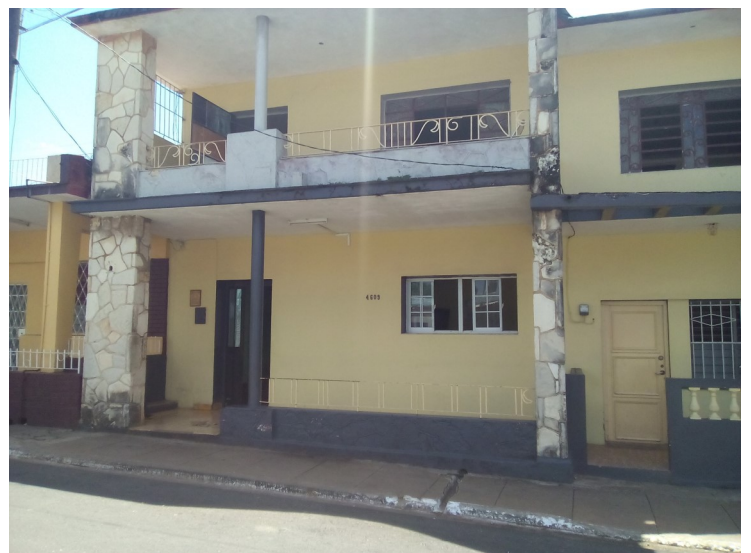
Hogar Materno del municipio cabecera

La misma fuente abundó que otro riesgo que las mantiene preocupadas es el laboratorio de análisis clínicos del policlínico Adrián Sansarico instalado hace más de dos años allí, con los riesgos biológicos que ello implica. Nos hemos quejado y dicen que se lo llevan nuevamente para allá cuando terminen