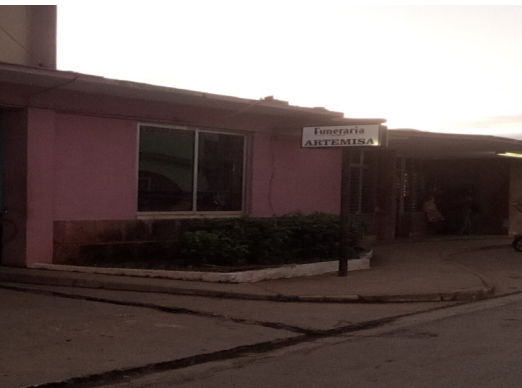
Funeraria de Artemisa (foto de archivo)

Mientras tanto la fosa sigue infestando el ambiente y que decir de los días de lluvia donde la misma llega a verter sus aguas al interior de la funeraria concluyó.