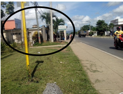
Policlínico Gilberto Marquetti