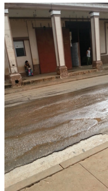
Almacén provincial de suministros médicos

Al cierre de esta edición se pudo corroborar que no solo en las farmacias del municipio Candelaria existe tan desagradable situación, en el municipio cabecera, también impera la desaparición de tan imprescindible articulo sanitario.