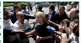
Luisa Ortega frente a las cámaras

“La señora Ortega llegó acompañada de su esposo el diputado Germán Ferrer”, indicó Migración Colombia en un comunicado. Luisa Ortega partió en la madrugada de este viernes en una lancha rápida hacia Aruba desde la Península de Paraguaná, en el estado venezolano Falcón, según informaron fuentes de la cadena estadounidense Univisión .