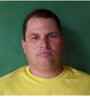
Por: Donel Baño Cubano de a pie