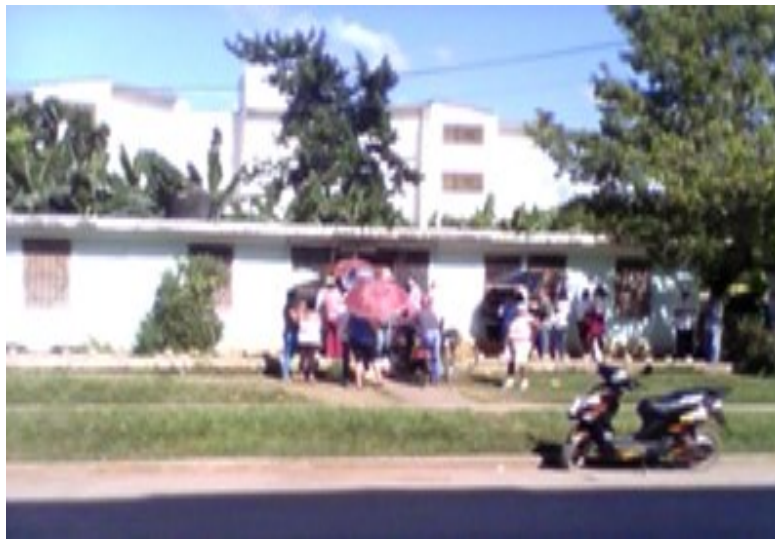
Farmacia La Micro del reparto Noel Caamaño.