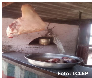
Quiosco donde sucedió el hecho.