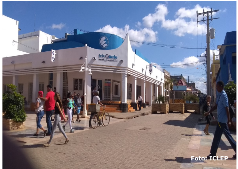
Oficinas De ETECSA, de Artemisa.