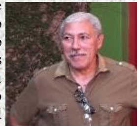
Pedro Pablo Oliva

Una vez más se le niega al pintor Pedro Pablo Oliva, Premio Nacional de Artes Plásticas, el derecho a exponer en el Museo de Artes de Pinar del Río, al ser considerada su exhibición como