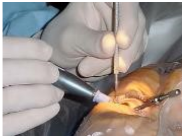
Operación de Catarata

En el Hospital Provincial Abel Santamaría de Pinar del Río, desde hace algún tiempo se vienen operando las cataratas sin que existan gotas dilatadoras. Es lastimoso y vergonzoso para un centro de esta categoría que no utilice este medicamento imprescindible, que además calma el dolor que se torna casi irresistible.