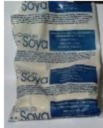
Bolsa de Yogur

Las bolsas en las que suele envasarse se exponen a la venta enfangadas, llenas de tierra, sucias y mal olientes, lo que evidencia la inexistencia de cierta preocupación de parte del dependiente, al ofrecer el insumo a los compradores.