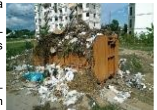
Imágenes de micro vertederos en la ciudad

En lo concerniente a los moradores ciudadanos, como culpables también de la problemática de su entorno, por