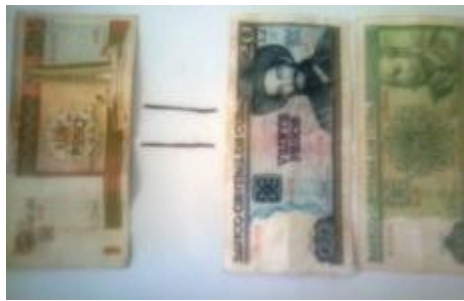
1 cuc, equivale a 25 pesos cubanos

El principal objetivo que se persigue con la unificación monetaria, es devolverle al peso cubano su "valor" como moneda nacional, así como sus funciones.