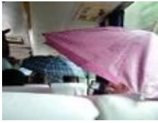
Imagen del interior de un ómnibus Yutong, y los pasajeros guareciéndose de las lluvias

Los ómnibus interprovinciales Yutong, son un ejemplo de la crisis de la cual atraviesa la provincia en cuanto al transporte, ya los asientos están rotos, cuando llueve se mojan más adentro que afuera, lo que obliga a los pasajeros a levantarse de sus asientos y otros abren sus sombrillas para protegerse de torrencial aguacero, que por los disimiles agujeros comien-