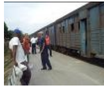
Tren de pasajeros

Otro de los casos que deja mucho que desear es el del tren, este está diseñado para transportar reses, no personas. Su estado interior es desastroso, asientos de hierro, incómodos e irresistibles, los baños sucios, pestilentes, y con una falta de higiene total, que hace imposible hacer las necesidades de los pasajeros que aborda dicho transporte.