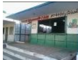
Ambas imágenes corresponden al mercado agropecuario