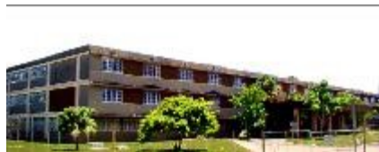
Hospital Abel Santamaría

El Hospital Provincial Abel Santamaría, más conocido por el pueblo pinareño como el hospital nuevo, es una construcción relativamente joven, de aproximadamente 10 o 15 años. Como toda moderna edificación estatal ha sido equipada con lo mejor en cuanto a tecnología, lo que ha posibilitado ofrecer un buen servicio.