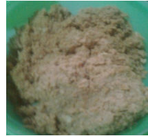
Picadillo de soya

Antonia, una pinareña siempre dependiente de la cuota, al no poseer más alternativa desgraciadamente, afirmó en días pasados que sería bueno que la quitaran, ya que ni siquiera es suficiente para alimentar a sus animales domésticos, los que no se quieren comer ni el picadillo de soya, que tanto les fascinaba.