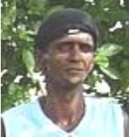
Por: Pedro Luis Díaz Gonzáles