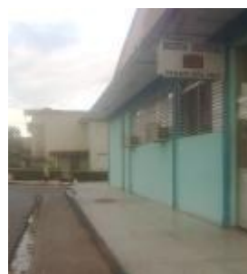
Cocina Central (P1) del Ministerio de Educación.

Esta es la envergadura que llegan a alcanzar las disímiles situaciones que acontecen en nuestro ámbito pinareño, evidenciando todo el tiempo la falta de respeto para con las diferentes personas e irresponsabilidades con el cumplimiento de las tareas, razones que motivan al descontento de una gran mayoría de la población.