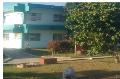
Sala del referido Hospital