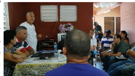
Imagen de participantes del Taller

Durante el taller se impartió una clase sobre la Constitución Cubana de 1976, de Derecho Penal y Procesal Penal, haciendo énfasis en los delitos más aplicados contra periodistas independientes, como evitarlos y las formalidades que deben cumplir las autoridades para practicar un registro a domicilio, citar y detener a un ciudadano.