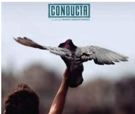
Portada de la Película Conducta

A la par asiste a la escuela, se preocupa por Carmela, su maestra a quien ayuda en todos los sentidos, es el niño que entra en cólera por defender al padre de su amigo Yoan preso por problemas políticos, al ser víctima de ofensas por otros estudiantes de la escuela.