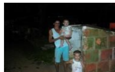
Familia viviendo en refugio