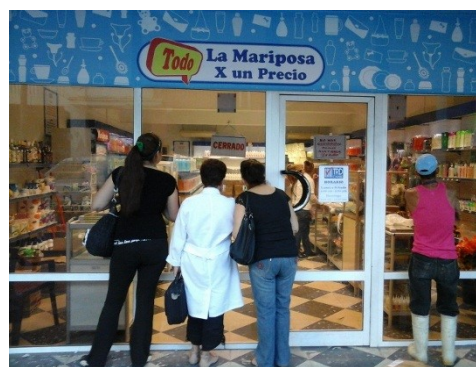
Tienda La Mariposa