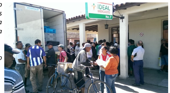
Imagen de la cola en el mercado cuando llegan los huevos