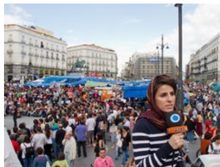
Imagen de corresponsal en Madrid.

a la sociedad a olvidarse de su propia existencia, si algo nos distingue hoy es la poca importancia que le damos a las cosas necesarias e imprescindibles para vivir, nada importa, nada ya interesa, es la gran realidad de un pueblo sin voz y muerto en vida.