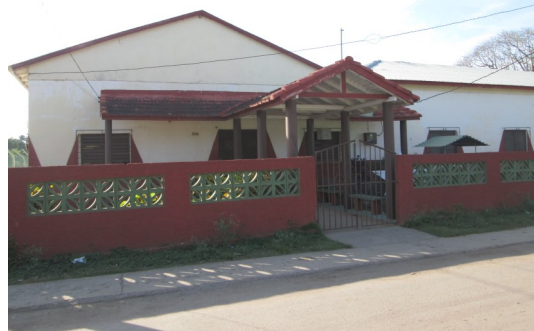
Fábrica de Tabaco “El Vizcaíno”