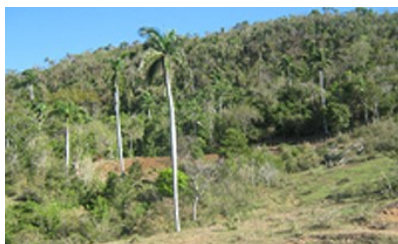
Loma del Seboruco