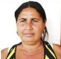
Por: Arelis Rodríguez Silva Periodista ciudadano

San Juan Y Martínez, Pinar del Río. La Dirección Municipal de la Vivienda del Municipio San Juan y Martínez, Pinar del Río, vuelven las espaldas y hace oídos sordos a las reiteradas solicitudes de los ciudadanos, que por cuestiones de necesidad allí se dirigen. Ya no hacen distinción entre hombres, mujeres o ancianos, cierran la puerta y dicen que no están, es la realidad que hoy se vive en este lugar.