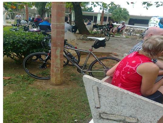
Parque central de Santa Cruz

“Acciones como esta para con el pueblo dejan mucho que desear. Hieren los sentimientos profundos de quienes estamos carcomidos de tanta frivolidad. Estos son pruebas fehacientes para reflexionar acerca de si deseamos continuar formando parte de los juegos estatales o acabar de socavarlos. Yo particularmente estoy en favor de la segunda idea”, confesó un vecino del lugar que pidió discreción en cuanto a la revelación de su nombre.