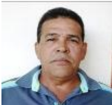
Por: José Clemente Corrales (Liborio) Periodista ciudadano