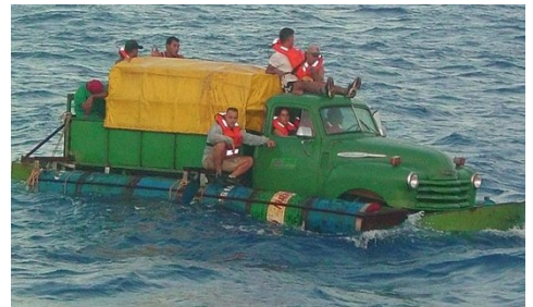
Imagen de balseros en alta mar.

Si se tiene que vivir así en la tierra que te vio nacer, sin esperanzas de tener una vida mejor, donde puedas realizar tus sueños de infancia y juventud, entonces sólo queda un camino para el pueblo, irse de aquí y jamás volver. En Cuba nada tiene razón de ser, el buen cubano llevará siempre la Patria en el corazón, donde quiera que esté.