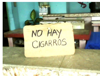
Imagen de cartel en Cafetería La pelota.