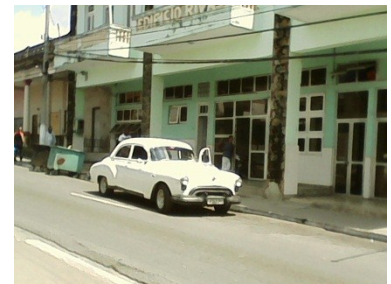
Estrella Roja, ubicada en Calle San Juan entre Sol y Virtudes.