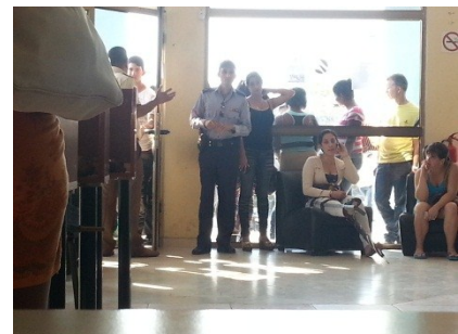
Imágenes del Tele punto.