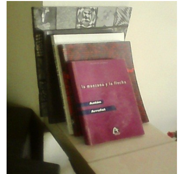
Libros expuestos en la recién concluida Feria de anteriores ediciones.