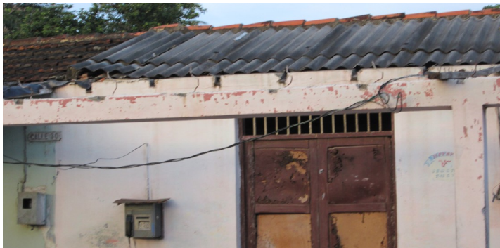
Teléfono Público en el portal de una bodega al descubierto