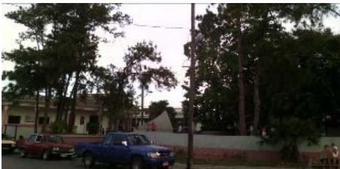
Parque El Bosque

“Vivo abochornado de estas actitudes, pues temo mucho que mi nieto de 5 años crezca viendo tales ejemplos, pues he sido siempre un servidor de la Revolución, y hace bastante tiempo que me lo cuestiono. Solo espero que, al menos, el parque El bosque, vuelva a recuperar su antigua distinción”, explicó finalmente el señor Capdevila.