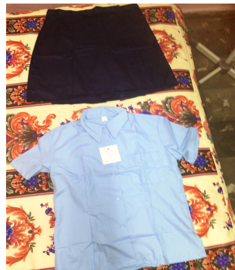
Uniforme de Pre-Universitario.