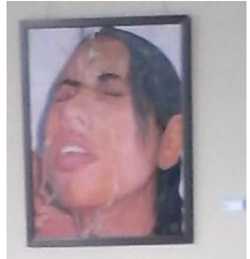
Juan Carlos Miló Calzada, s-t, óleo lienzo.

refrescante. Su influencia de las naturalezas muertas de Arturo Montoto, convierten en atractiva la pieza, por ese juego semántico que sostiene entre la representación de la fruta bomba conocida vulgarmente como papaya, tan semejante en forma y por esta última denominación a la vulva femenina.