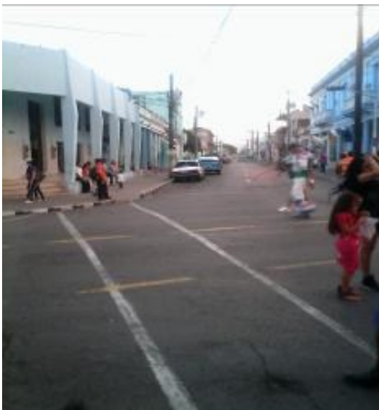
Calle Recreo en noche de carnaval pinareño, a las 8 y 15 pm.

citadino de Pinar del Río durante la celebración de los carnavales. Fueron una total falta de respeto, unido a la suciedad que dejaron, pues la mayoría de los establecimientos no se limpiaban después de haber transcurrido una jornada, el reguero de papeles pululando en las calles fue una constante que los definió”, culminó diciendo Pereda