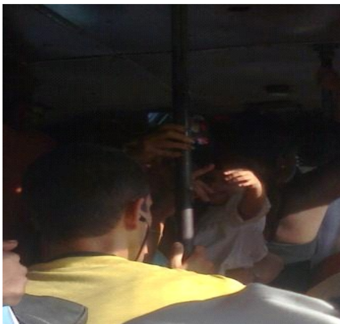
Madre que viaja con bebé en brazos en un ómnibus lleno

“Tal vez todo sea más simple y uno de los motivos radique en el temor conque nos programan desde pequeños al iniciar nuestra vida escolar, donde todo lo que posea trazas de Capitalismo y des colectivización es nocivo, y por tanto, ajeno a los principios revolucionarios, los cuales constituyen el primordial freno hacia la realización personal del individuo, que al no poder ser coaccionado por la maquinaria gubernamental se aleja del comprometimiento que representa la dependencia económica de un salario en cualquier centro laboral estatal. El sector privado, por su parte, figura como un probable ente activo de la Sociedad Civil que escapa, de los férreos mecanismos de control del régimen”, terminó diciendo el señor Galarraga.