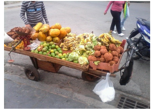
Carretillo con su puesto de venta en la vía pública