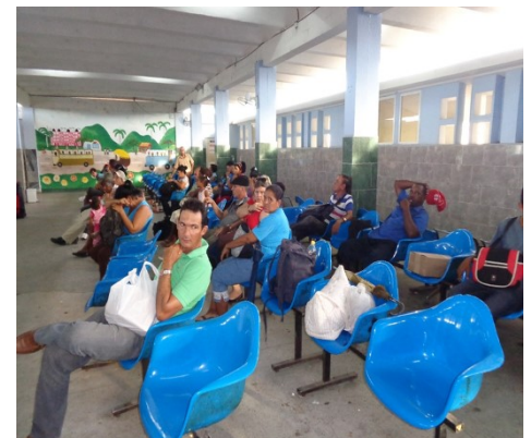
Pasajeros en espera del ómnibus con destino a Briones Montoto