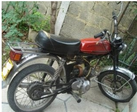
Motor bejomina sin piezas de repuesto

“No estoy de acuerdo con las compraventas que se hacen en SASA, la atención fue buena, pero un ciudadano cubano con su sueldo pasa dos o tres años reuniendo una cantidad de dinero como en mi caso para poder comprar una unidad de moto, la cual cuesta mucho dinero, y como están las cosas hoy en día eso es un sacrificio enorme que hay que hacer para poder reparar el vehículo quienes poseemos la suerte de tenerlo. Por lo que nos dijeron, existe una supuesta lista para poder anotarse ya que no se sabe cuándo entran las unidades; pero eso no les da derecho a para vendernos esa pieza en las peores condiciones, sólo para salir de nosotros. Además, no estoy de acuerdo porque no tenemos un respaldo o algo que nos de la garantía de que lo que compramos aquí sirva. Lo que me pasó a mí como a los demás, estoy seguro que no pasa en ningún lado del mundo, ya que compré la unidad y pagué para adaptarla al cuadro de mi moto marca Karpaty. Cuando la monté la unidad tenía el cigüeñal fundido, las cajas de bolas y los piñones estaban oxidados. Yo me pregunto ¿dónde reclamo lo que me pasó?”, confesó el señor afectado.