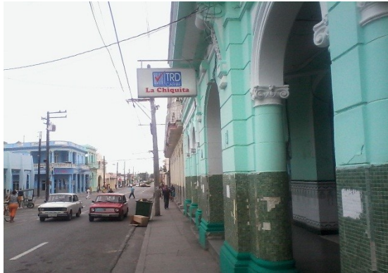
Tienda La Chiquita, en calle Martí

“La posición del consumidor debía ser es no comprar el producto, pero es que la necesidad nos lleva a adquirirlo como quiera que esté, así como el cansancio que provoca el hecho de que nuestras peticiones y derechos sean ignorados como de costumbre. Para qué luchar entonces contra un complot generalizado obligado a ma-