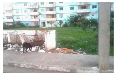
Depósito para los desechos en Reparto Hermanos Cruz