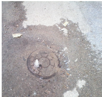
Salidero de agua potable en la vía pública

"Es una falta de respeto lo que tienen con nosotros. Acueducto no se encarga de mandarnos las pipas con frecuencia para coger agua potable aunque sea para beber porque la salobre no calma la sed, solo la empleamos en la limpieza y cocción de los alimentos. Aquí vivimos una gran cantidad de personas niños, adolescentes y adultos. Necesitamos la asiduidad de ese servicio porque hasta ahora ha sido insuficiente. Ya lo hemos informado en disímiles ocasiones, pero conti-