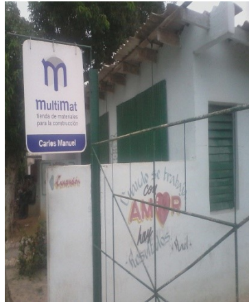
Rastro ubicado frente a la terminal del ferrocarril, en calzada a La Coloma

"Es una lástima que yo dependa de mi salario para construir, pues si hubiese tenido dinero las pudiera haber comprado a los revendedores que no dan chance. Lo que surgió para viabilizar el acceso a los materiales de construcción, hoy deviene grave problema motivado por las indisciplinas de aquellos que ven en los rastros un desmedido negocio, que ha carecido de un control estatal riguroso", culminó explicando Edmundo.