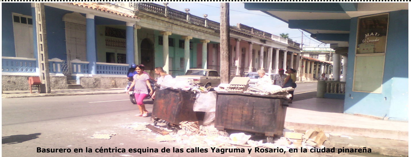
Basurero en la céntrica esquina de las calles Yagruma y Rosario, en la ciudad pinareña