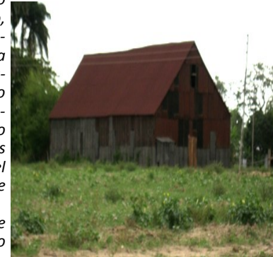
Casa de curar tabaco

ca es a un valor menor de los ocho mil pesos el quintal, cuando a nosotros nos lo paga a mil pesos, o sea, que siete mil pesos le quedan libres de ganancias a estos organismos",