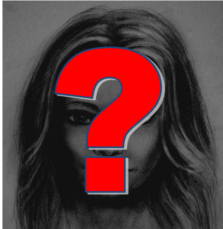
Teresa la soñadora, Cubana de a pie

Aun estamos a tiempo, salvemos la juventud cubana. Los que no han tenido la culpa de nacer en esta época, bajo un régimen totalitario.