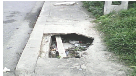
Hueco en acera que preocupa a vecinos

“Ya hemos ido al Poder Popular y hemos llamado la atención al respecto. Este hueco es un peligro potenciar para la vida de los ciudadanos que diariamente transitan por ese lugar. De noche es el peligro mayor, cualquiera que venga entretenido y no sepa de su existencia, caería en el mismo, provocando un lamentable accidente. Hemos dicho que si la empresa o el organismo encargado de taparlo no acciona como es debido, nosotros movilizaremos al pueblo y lo denunciaremos a todos las instancias gubernamentales que sean necesarias”, así comentó un funcionario de Salud Pública