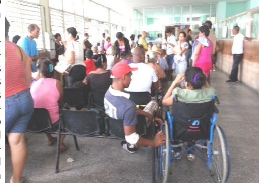
Cuerpo de guardia del hospital León Cuervo Rubio (Hospital viejo)

La infección de dengue por la que atraviesa la provincia es seria y difícil por las pésimas condiciones que tiene. Esta situación ha puesto en tela de juicio el concepto de potencia médica del cual se ufana la nación cubana.