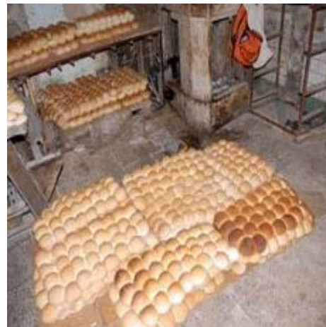
La realidad de las panaderías cubanas

Cuanta riqueza se escapa a la basura o a los animales de cría, por esta indolencia. Por la mala creación pierde el consumidor y las arcas de Estado.