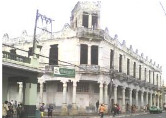
Ruinas del antiguo hotel Comercio

El Gobierno Provincial ha lanzado un plan para reanimar la ciudad hasta el año 2017, son muchas quejas y señalamientos por parte