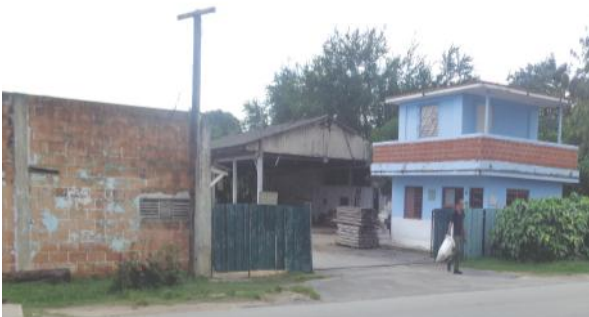
Unidad de Aserrió atrasada en el pago a sus trabajadores

El pago de los trabajadores es sagrado. Ellos contraen obligaciones, y tienen responsabilidades no sólo con la entidad para la cual trabajan, tienen que cumplir con la mantención, guarda y cuidado de la familia. No hay excusa para atrasar el pago de los trabajadores. Es una violación grave.