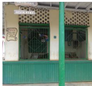
Punto de venta estatal (Placita)

“Desde que se anunció el restablecimiento de las relaciones entre Cuba y Estados Unidos, la cosa está que arde, se ha perdido la comida, la ropa. Yo no sé qué vamos hacer porque sin co-