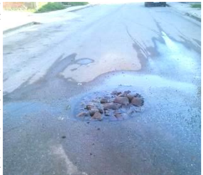
Hueco en medio de la calle donde se accidentaron un señor y su hijo.

Esta situación es conocida por todas las entidades y no sólo la de este lugar, hay muchos y en todas partes de la ciudad, no realizan esfuerzos por eliminarlas. Viales, Acueducto y alcantarillado deben dar respuesta por este lamentable accidente que pudo ser peor.