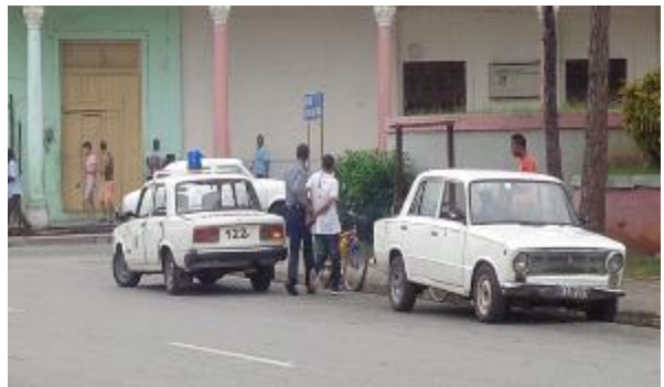
Momentos en que la policía conducía al falso médico

Hechos como este hay que evitarlos para no poner en riesgo la seguridad de adolescentes y adultos, que restan el prestigio de la institución.