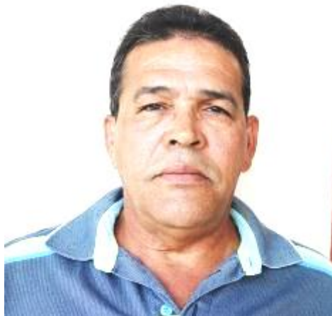
Por: José Clemente Corrales Periodista ciudadano

La producción del pan, alimento común es un arte muy antiguo, objeto de culto y ofrenda en muchas civilizaciones pasadas y presentes. En tumbas y pirámides del Egipto antiguo, se han descubiertos varios tipos y calidades de este nutriente, lo que demuestra la importancia del producto en la alimentación del hombre a lo largo de la historia.