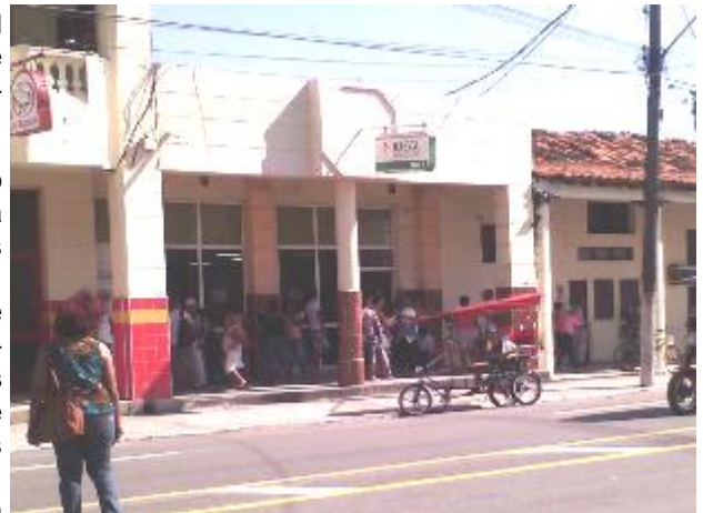
Mercado Ideal en calle Martí

El lema “El cliente siempre tiene la razón” se niega en estos establecimientos donde el pueblo tiene que acudir por necesidad y siempre sale insatisfecho: elevados precios, mercancías deficitarias, caras largas y hasta muecas, muestran los pocos