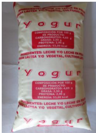
Bolsa de yogurt

Las quejas al administrador de esta cafetería han sido varias a las cuáles él ha respondido con la ignorancia, y la burla a la población con la continuación de esta problemática.