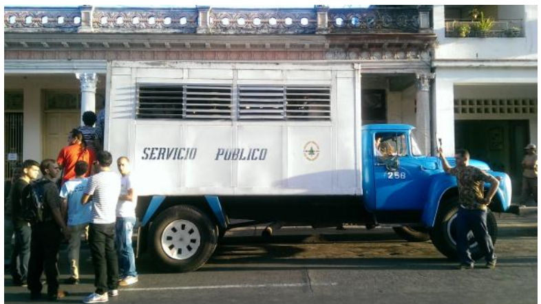
Transporte público similar al que realiza los recorridos de Punta de Palma y Briones Montoto

No se pueden seguir tomando medidas sin tener en cuenta las necesidades objetivas de la población, la designación de estos vehículos cuya capacidad se ve reducida ante el número creciente de pasajeros es una muestra de la incapacidad de la Administración Pública en este territorio.