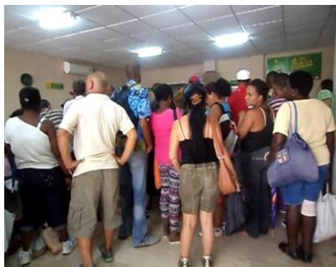
Cola en Mercado Ideal por la venta de marisco

y cuando se trata de mariscos y productos lácteos más aun, porque los mismos son de mucha demanda y poca adquisición. Las entidades estatales deben surtir con más frecuencia y en diferentes puntos de ventas estos productos para evitar que hechos como estos se repitan.