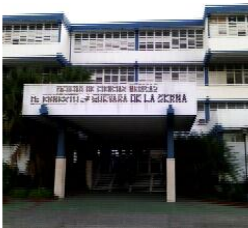
Universidad de Ciencias Médicas Ernesto Che Guevara

Las malas decisiones políticas de quitar de sus funciones medicas a estos especialistas, afecta en grado sumo a la población en sentido general y por estas y otras acciones protestamos, aunque sabemos que la democracia no es una característica de nuestro país.