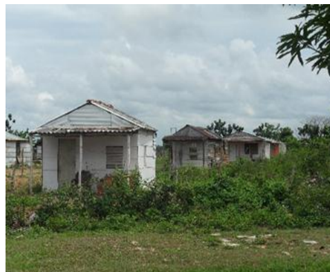
Viviendas en peligro de ser demolidas

vivencia han llevado a la población a que busque sus propias alternativas, demostrando una vez más la incapacidad del Estado para resolver un problema creado por el mismo. Arrancar de raíz a comunidades enteras por sus ideas políticas ha sido y sigue siendo uno de los grandes errores por este gobierno llamado del pueblo y para el pueblo. Al final no son otra cosa que pueblos cautivos.