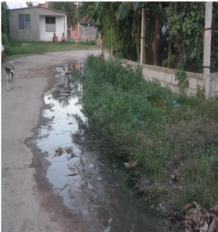
Aguas albañales corren libremente por las calles del reparto Lázaro Hernández Arroyo

Se pudo comprobar en el lugar de los hechos, que los vecinos tuvieron que sacar estas aguas fétidas y contaminadas por sus propios medios. Las soluciones que encontraron fue hacer zanjas en sus patios, cocinas y pasillos para que corrieran hacia la calle, lo que empeoró la situación.