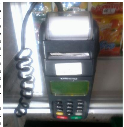
Dispositivo para el cobro por tarjeta magnética

Mejorar la viabilizarían del pago con tarjetas magnéticas en las tiendas TRD, se convierte en una prioridad de cada entidad, ya que la demora en esta asistencia ocasiona serias molestias a la población y atenta contra la calidad y excelencia en los servicios que desempeñan a diario.