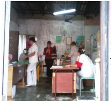
Interior de los consultorios 19 y 46