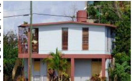
Consultorio Médico # 56 en Briones Montoto

Los pobladores de esta comunidad esperan que las autoridades pertinentes tomen medidas con los responsables de esta situación para que hechos como este no se repitan, pues afecta la salud y el bienestar del pueblo.