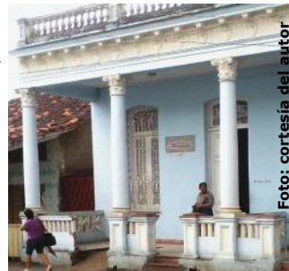
Dirección Municipal de Vivienda

La pésima atención que brinda esta entidad se ha convertido en un elemento distintivo de la labor que se lleva a cabo, generando inconformidades en la población. Pese a las quejas presentadas al Director de la institución a raíz de diversas problemáticas acaecidas ha primado el silencio y el desinterés, aliados del caos que sigue ganando espacio.