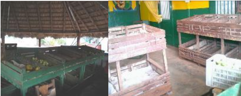
Mercado Agropecuario la Línea, placita de Calle Frank País ambos desabastecido

Las placitas en Pinar del Río son una muestra del huracán que las azota, ejemplo, tarimas vacías y dependientes sen-