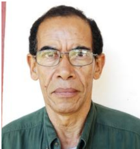
Por Eduardo Pujol Valladares Periodista ciudadano

Escribir, expresar libre y espontáneamente nuestros pensamientos o ideas acerca del gobierno y su forma de gobernar, es tomado por las autoridades cubanas como un acto de desagravio contra la Patria y su historia, por lo que convierte al periodista en un ciudadano desafecto a la Revolución y a su máximo líder. Ello traerá como consecuencia el castigo que actos como estos llevan, según lo establecido y practicado; represión contra la familia, expulsión del trabajo, y como es natural ser estigmatizado como contra revolucionario, lo que significa ser sepultado en vida sin que nunca más puedas levantar la cabeza en la tierra prometida.