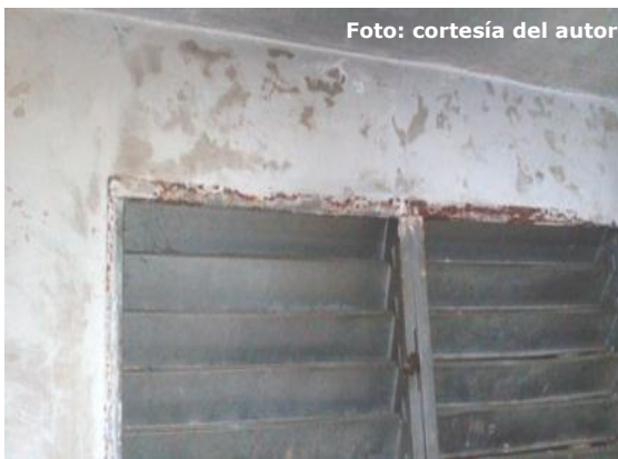
Ventanas en mal estado de la vivienda de Marilú