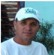
Por: Rolando Pupo Carralero Periodista independiente

Somos cubanos y muchos nacimos en la década de 1970, todavía en este tiempo la dictadura liderada por Fidel Castro recibía los favores de la extinta Unión Soviética, que se terminaron después de su derrumbe a finales de 1991. Tuvimos la “suerte” como dicen algunos, de vivir algunos años de nuestras vidas gozando de algunas comodidades económicas, pero bajo la doctrina de un sistema totalitario que nos despojaba de lo más preciado del ser humano: “La libertad”. Como es lógico, en aquel entonces no lo entendíamos de esta manera por nuestra corta edad, pero ya algunas personas mayores susurraban en nuestros oídos el total rechazo por aquel sistema. Estos susurros despertaron cierta curiosidad, para más adelante empezar a buscar respuestas a muchas de las interrogantes. Tarea que no era muy fácil en la Cuba Comunista, ya que nos educaron bajo los consejos de nuestros padres, “hijo no hables mal de la Revolución que nos meten presos”.