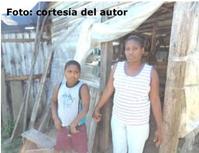
Esposa e hijo de Oslirio en su humilde hogar