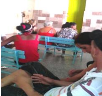
Pacientes en espera del servicio de rayos x