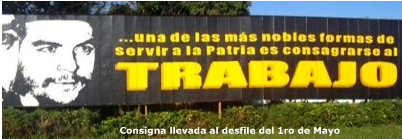
Consigna llevada al desfile del 1ro de Mayo