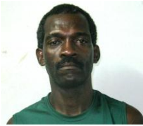
Por: Eliosbel Garriga Cabrera Periodista ciudadano

Un potro al poco tiempo de nacer, se levanta y por instinto sobre sus largas y temblorosas patas, comienza andar y sigue a su madre. Un bebe, en cambio, puede que tarde un año en dar sus primeros pasos. Sin embargo, los seres humanos están dotados de un sorprendente cerebro que supera con creces al de los animales. Dicha superioridad se evidencia en la insaciable curiosidad del pequeño y en su pasión por descubrir y aprender cosas nuevas.