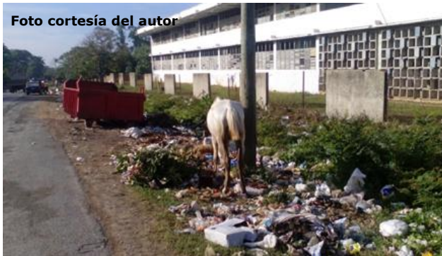
Crece el basurero con desechos de todo tipo