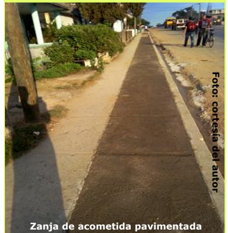
Zanja de acometida pavimentada

Es un abandono total por parte de aquellos que tienen la responsabilidad de ejecutar estas obras”, agrega seguidamente, “todavía seguimos en riesgo por esa lentitud de los responsables en la terminación de esta obra, espero que un día la culminen y yo esté vivo para verla”.