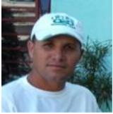
Por: Rolando Pupo Carralero Periodista ciudadano