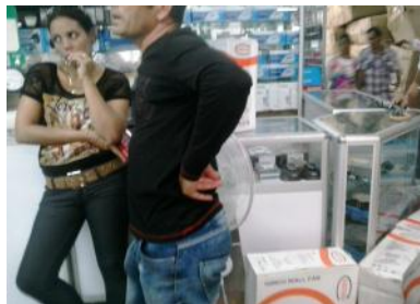
Personas en espera de la venta de ventiladores

Hechos como este, causan malestar e inconformidad en la población, demostrando la mala coordinación de los administrativos, al final quien sufre y "paga los platos rotos" son los clientes que pacientemente esperaron todo un día