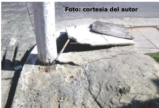
Esquina de las calles Retiro y Polvorín