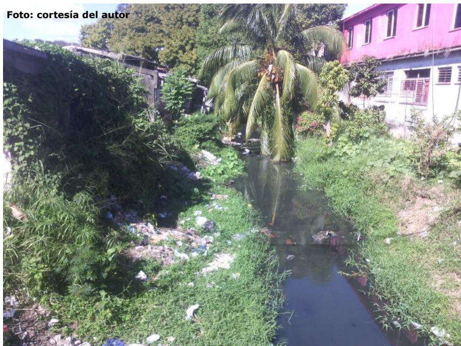
Desechos sólidos en el Arrollo de Galiano