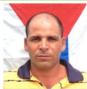
Por: Yusniel Pupo Periodista ciudadano