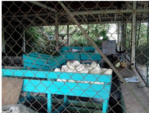
Una de las placitas de referencia

precios, estos los establecen la Empresa Municipal de Comercio.