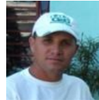
Por: Rolando Pupo Periodista ciudadano

Corresponde a las autoridades competentes locales y de Tránsito, velar porque los campesinos, mantengan sus animales atados en lugares seguros y cercar el perímetro de sus propiedades que colindan con la carretera.