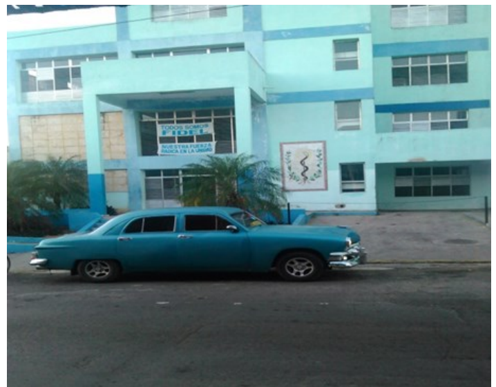
Institución de salud "Turcios Lima"

El Ministerio de Salud Pública y las Instituciones Gubernamentales, deben procurar resolver situaciones, donde el pueblo no sea afectado. ¿Acaso no es esto maltrato al pueblo?, no se concibe una "Potencia médica sin agua".