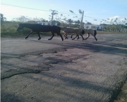
Vial con peligro para el tránsito