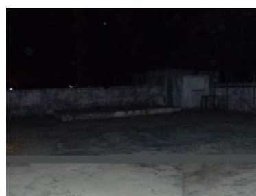
Centro de recreación

En otras ediciones de este medio, se ha publicado el pésimo estado de ambientación de este local y de la incomodidad que sufren las personas que llegan hasta el. Es un local al aire libre, porque perdió el techo, no cuenta con asientos y el equipo de música está en muy mal estado, aunque no tanto como el inmueble.