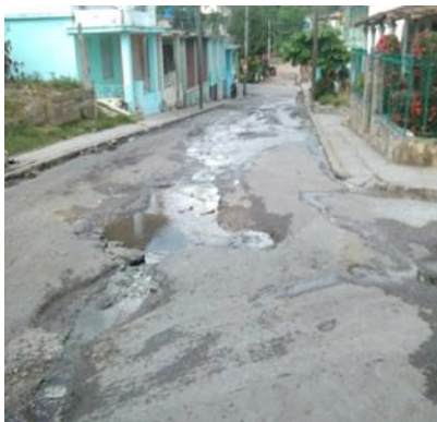
Hueco en calle "Coronel Pozo"