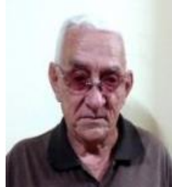
Por: Calixto E. Miranda Landeiro Cubano de a pie

además que niños estudiantes del municipio La Palma, tienen que regresar para sus casas porque no tienen profesores que le imparta las clases ya que estos se han convertido en cuentapropistas. Sobre la yunta de bueyes, el artículo no aclara si forma parte del robo de cerebros, pero se explica que los bueyes no tienen quienes los guíen en el trabajo, esta situación es el resultado de una inadecuada política salarial que por muchos años afecta sensiblemente la alimentación de los cubanos, el precio de la vida económica de la sociedad se mantiene muy por encima de