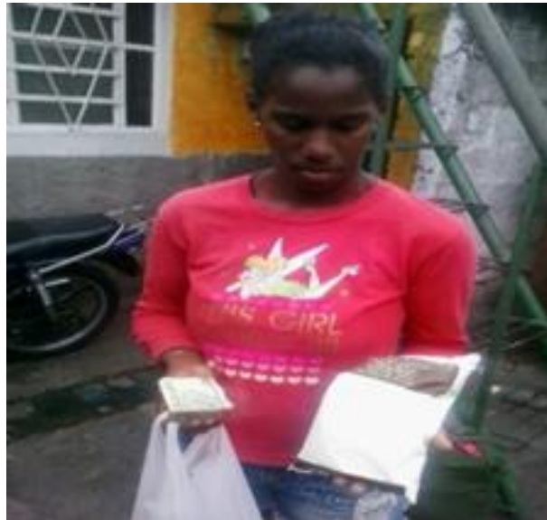
Bolsa de leche para niños

de que nuestra ciudad cuenta con un Combinado Lácteo, las ofertas no llegan a toda la población ni cubren las necesidades más básicas. Casi todos los productos son exportados o se venden en las tiendas recaudadoras de divisas a muy altos precios, desconsiderando así la necesidad poblacional. Mientras la prensa oficialista le informaba al pueblo de un cambio de leche fresca por leche en polvo.