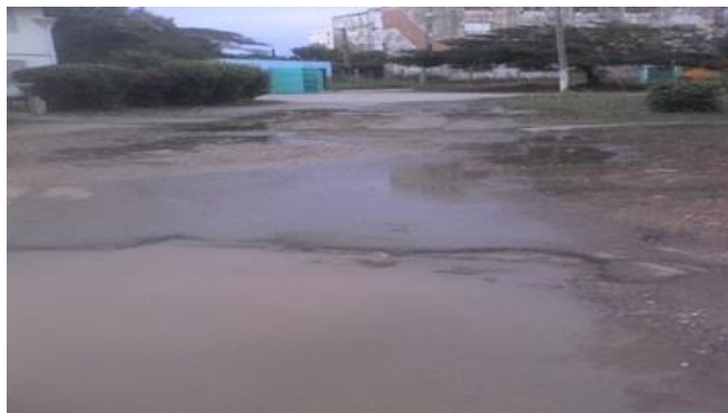
Derroche de agua potable

Pinar del Río, (ICLEP). La escasez de agua potable en el sector residencial de dicha ciudad cabecera, se ha hecho insoportable. Este problema ha provocado que la incomodidad, las necesidades y la insatisfacción de los pobladores se incrementen cada día más.