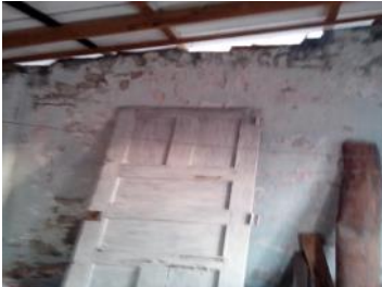
Vivienda en mal estado

Los ciclones "Lili" e "Isidore", azotaron nuestra provincia en el año 2002, por los cuales varias familias fueron afectadas. Sus viviendas casi desaparecieron o quedaron en un estado deplorable, tal es el caso de esta ciudadana residente en el Reparto Hermanos Cruz, en la calle A No-1, entre 1ra y 2da, quien vive con su hijo, de 42 años con problemas psiquiátricos y sólo recibe una pensión de 200 pesos. La casa de esta señora está semi-derrumbada, sin techo, las paredes agrietadas y utilizando una habitación como único lugar habitable, de lo que quedó de su inmueble.