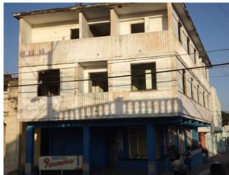
Hotel Panamérica, San Juan

Desde su construcción en los años 50 sus propietarios y arrendadores "Los Fortezas" y "El Cabo Pérez", siempre se esforzaron por mantener el confort del mismo para dar una cálida bienvenida a los transeúntes y huéspedes que allí se alojaban. Después del triunfo de la Revolución, pasó a manos del Estado, y a la llegada del Período Especial, comenzó su prolongado deterioro. Después del paso de los ciclones Isidoro y Lily, el gobierno municipal tuvo como iniciativa, albergar en sus instalaciones a un grupo de familias damnificadas. Decisión fatal, que provocó la destrucción total y tuvo que cerrar sus puertas al pueblo sanjuanero y a quienes allí