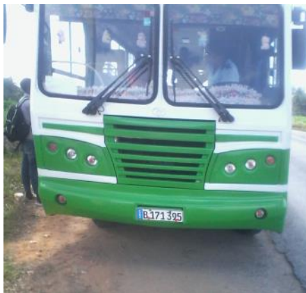
Ómnibus Diana, San Juan y Martínez

San Juan y Martínez, es un pueblo que se encuentra a veintiséis kilómetros de distancia de la ciudad cabecera. Gran parte de sus pobladores laboran en Pinar del Río. Cuando se interrumpe el transporte urbano, las afectaciones de los ciudadanos son varias, pro-