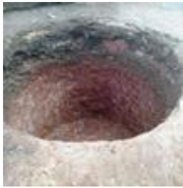
Hueco para cisterna

Autoridades de la Empresa de Acueducto, alegaron que las tuberías hidráulicas son muy viejas, están deterioradas por el tiempo, lo que agrava la situación. Muchas veces hay roturas, es otro motivo por el cual, no les llega el agua con frecuencia.