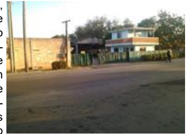
Unidad - "El Aserrío"

"No hay atención al hombre, ni estímulos, pagan fuera de lo establecido. El veintiuno de junio fue el día del trabajador forestal y nadie se acordó de nosotros. Dicen que la Empresa no tiene dinero, nuestra entidad vende carbón por divisa y a los carros de los dirigentes no les falta nada (gasolina o petróleo)". Situaciones como