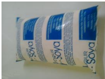
Bolsa de Yogurt

Pinar del Río, (ICLEP). Los envases utilizados en el yogurt de soya, que son asignados por la cuota para niños de siete a catorce años, no prestan la seguridad adecuada. Se rompen con facilidad, provocando molestias en la población y limitando la calidad del producto que debe llegar en buen estado a los consumidores.