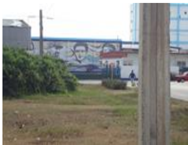
Mural, Combinado Pesquero

Desde la década del 90 del pasado siglo, los trabajadores del combinado, pagan un impuesto o contribución, que supuestamente es usada para el desarrollo de la comunidad La Coloma, donde la mayoría reside. Las protestas por el mural, se centran en la sospecha de que sus aportes para el desarrollo local, fueron los que financiaron la obra de arte. Sin un manejo transparente de esos fondos, ni siquiera les informan oficialmente a los contribuyentes, en qué son usados. Para aplacar los ánimos, los funcionarios comentaron que se usaban para mejorar las instituciones de salud.