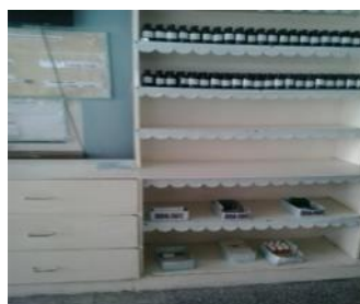
Estante de la Farmacia

En la farmacia del Hospital Abel Santamaría, algunos estantes están vacíos, carentes de varios tipo de medicamentos, sin embargo se venden otros accesorios como: bolsas de combinación a un precio de doscientos veinticinco CUP y curitas a cincuenta pesos cada caja; así como aplicadores de oídos a veinticinco CUP y embaces de hilo dental a setenta y cinco CUP. Lo que ha creado descontento en la población, pues los precios son muy altos. Al mismo tiempo, los medicamentos de primer orden que se venden por tarjetones o recetas médicas, siguen ausentes.