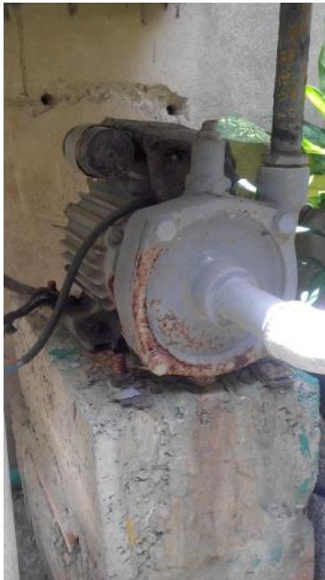
Motor de agua