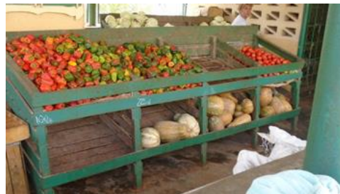
Local de venta en espera del tomate

En la CPA "Agustino Neto", ubicada en el municipio de San Luis, las infracciones que se cometen, aumentan gradualmente al dejar que estas apetitosas hortalizas, se pudran y no lleguen al pueblo.