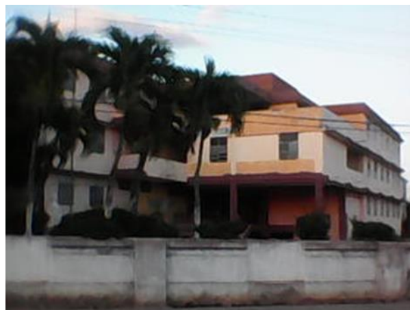
ESBU Anteros Fernández Vargas, San Juan y Martínez