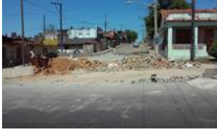
Calle obstruida por reparación

Pinar del Río, (ICLEP). Provoca malestar y preocupación entre los vecinos que a diario tienen que transitar por Avenida Alameda, esquina Méndez Capote, por una reparación en la calle que parece no tener fin. Una brigada privada contratada por la Empresa de Acueducto y Alcantarillado, reinician esta obra, destinada a recoger las aguas albañales, que por mucho tiempo se escapan del Hospital Pediátrico "Pepe Portilla" y de la Empresa antes mencionada.