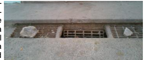
Desagüe en la calle tupidio

La ciudad de Pinar del Río, está llena de casos similares sin solución, como si esperaran un desastre natural provocado por las lluvias que próximamente se avecinan. Lo cierto es que estamos en presencia de un abandono total que a nadie le interesa la salud y la seguridad del pueblo.