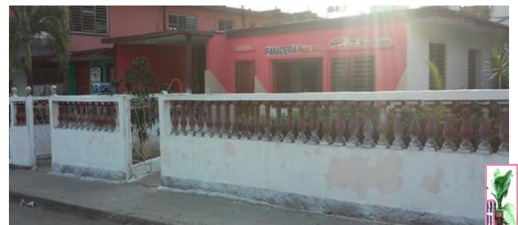
Panadería Hermanos Cruz