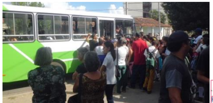
Ómnibus Diana destinado a la Coloma