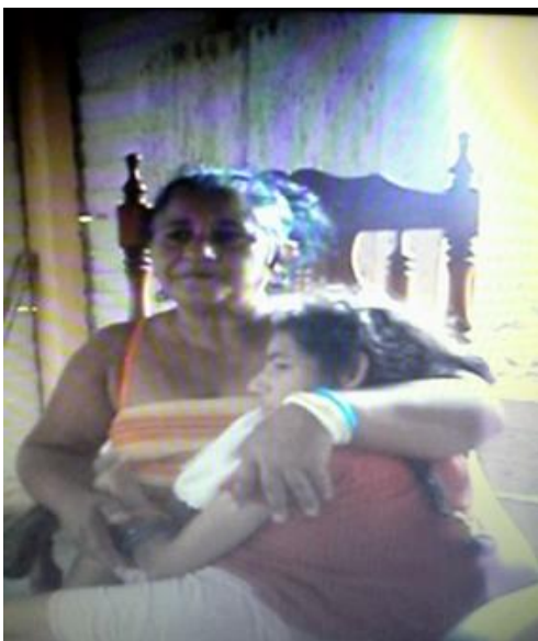
Madre con su hija en los brazos

“Vivo en una casa que se encuentra en muy mal estado, pero lo peor del caso es que tengo una hija de 33 años enferma de Encefalopatía Crónica. Tengo que cuidar de mi hija todo el tiempo, dada su condición y su enfermedad no me permite trabajar. En mi núcleo familiar el único sustento es el de mi esposo, para nadie es un secreto que con los bajos salarios que gana un trabajador en Cuba es muy difícil cubrir todas las ne-