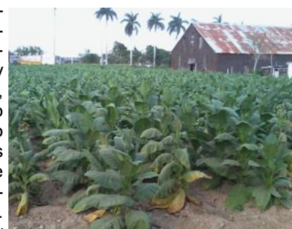
Siembra de Tabaco

"Los campesinos esperan que este año puedan satisfacer parte de sus necesidades básicas, por los buenos dividendos que les pueda quedar después de vender su tabaco al Estado (único comprador). Aunque continúan siendo injustos los modelos de producción y la forma de comercialización impuesta por el monopolio estatal"; expresó, Herminio Salazar, otro cosechero de la localidad.