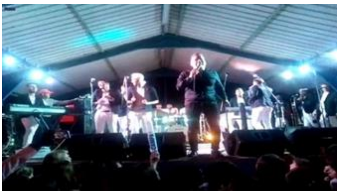
Imagen tomada comenzando el show en la Coloma

“El gobierno del territorio, conociendo este serio problema, permite que se utilice y malgaste el presupuesto del Estado para continuar enriqueciendo a un grupo de personas. Al poblado de la Coloma, vienen los grupos musicales una vez al año, las fiestas populares se pueden realizar con música grabada, no se debe permitir que un grupo de personas continúen jugando con los bienes del pueblo trabajador”; dijo Maritza Cubilla, trabajadora del Combinado.