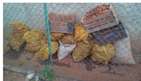
Papas podridas a un costado del punto de venta