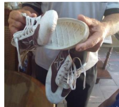
Foto de los tenis despegados