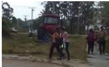
Imagen de los hechos.