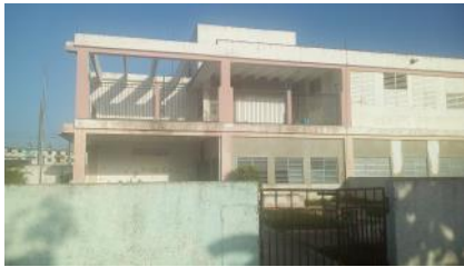
Frente del Círculo Infantil

La Coloma, Pinar del Río, (ICLEP). A punto de concluir sus reparaciones el Círculo Infantil "Pececito Dorado", único de este tipo en nuestra comunidad pesquera, y que ha permanecido cerrado por reparación durante once meses, desde junio del año 2016, que recesaron todas sus actividades, por el estado tan deplorable que presenta dicho centro educacional. Los niños que se encontraban en este círculo infantil, gran