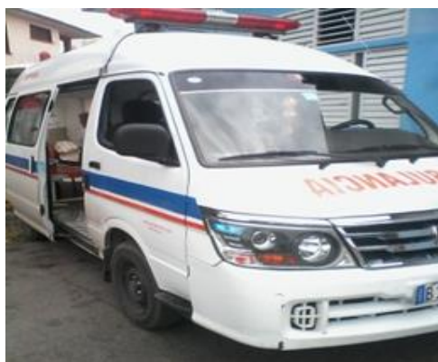
Servicio de ambulancia

Insatisfacción hacia el personal paramédico que labora en las ambulancias por la demora de recogida a personas incapacitadas y operados, que dependen de este medio para resolver su problema, y poder trasladarse desde su domicilio, que puede ser dentro o fuera de la ciudad cabecera, hasta el Hospital Provincial Abel Santamaría de nuestra ciudad.