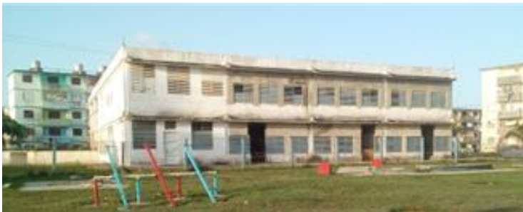
Parte posterior del Círculo Infantil "Pececito Dorado"

En el interior del Círculo Infantil, se encuentra un grupo de trabajadores con un sólo afán, el de concluir dichas reparaciones, dando los retoques finales, como la electricidad, pintura y algunas puertas que están por entrar. Según el coordinador de la brigada de construcción, que no quiso dar su nombre, comentó: "Se espera que en la segunda quincena de julio todo esté listo para reanudar las funciones del círculo".