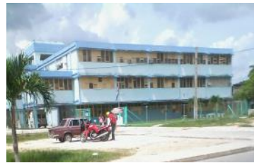
Policlínico "Hermanos Cruz"

Pinar de Río, (ICLEP). En nuestro país la pérdida de valores ha llegado a todas las esferas sociales, pero en la salud pública, llegó para quedarse y cada día es peor. La desatención y la deshumanización, entre otras faltas de respeto asisten al policlínico comunitario Hermanos Cruz.