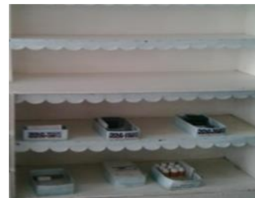
Exhibición de la escases de medicamentos.

que llegan no salen al mostrador, dicen que también tienen enfermos. ¿Quién le pone el cascabel al gato?, yo soy paciente, no policía.