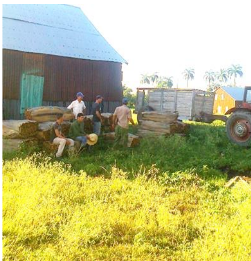
Campeños en la preparación del tabaco para venderlo al Estado.