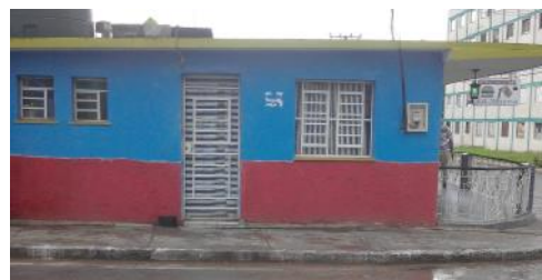
Imagen de la cafetería "La Nueva".

"Con los establecimientos cerrados no hay donde merendar, todos los días venía a la cafetería La Nueva, comía lo que podía, pero las están pintando, cambiando luces, arreglando tuberías y salideros, entre otras gestiones. Ahora después de