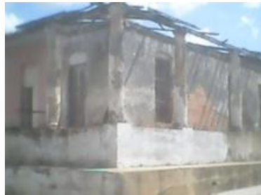
Ruinas del Hotel "Acogedor"

Como siempre, en saco roto, Liborio paga. Corresponde al Estado, máximo responsable de los daños ocasionados, la reparación del Hotel, en el que se debe hacer gran inversión económica en cientos de miles de pesos, para el pago y adquisición de materiales y mano de obra, agregando más inversión monetaria para la compra de equipamientos habitacionales.