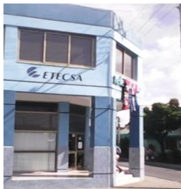
Tele-Punto ETECSA en la ciudad cabecera.