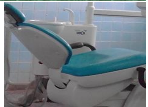
Silla reclinable en la que se atienden los pacientes de estomatología.

Casos como este se acercan a nosotros con frecuencia, para transmitirnos su incomodidad. No sólo por la demora y lo engorroso de los trámites, sino también, por la mala calidad de los materiales con que se está trabajando, son poco consistentes y su duración es limitada.