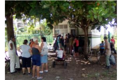
Personas en espera para la compra del Gas licuado.

venta, manifestó: "Estoy muy descontento con el proceder y el mecanismo utilizado para adquirir el Gas. Además de pagar los elevados precios, tuve que trasnochar marcando en la cola durante tres noches. Existen dificultades con el personal encargado de realizar los contratos, pues llegan tarde y no tienen hora fija para comenzar. Son muy desconsiderados y abusivos los precios que el Estado a puesto al servicio de gas licuado que tanto necesitamos".