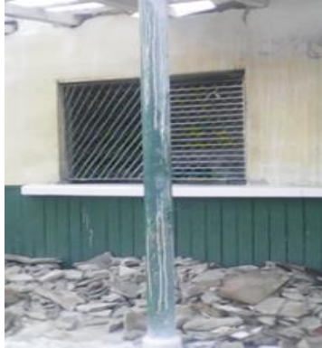
Placita en destrucción.

agropecuarios como: viandas, hortalizas y frutas; para llevarlos a la mesa, ahora sólo hay escombros".