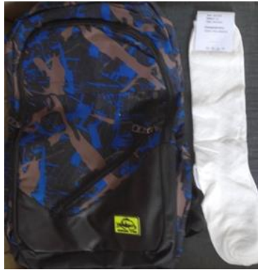
Imagen de mochila y medias para el uso del uniforme escolar.

tos de la base material de estudio que necesitan los educandos para un satisfactorio curso escolar está garantizada, pero no es cierto". Concluyó Nora.