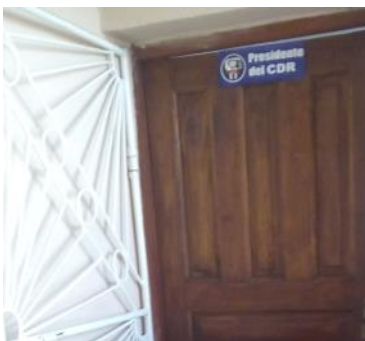
Imagen que muestra el papel pega, anunciando la vivienda del presidente de CDR, principal encargado del sistema de vigilancia local en las comunidades.