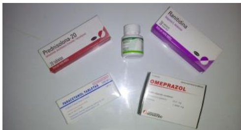
Imagen de algunos medicamentos ausentes en las farmacias pinareñas.

"Se terminó el mes y no pude comprar los medicamentos del tarjetón (recetario permanente de medicamentos por indicación médica), esto se ha vuelto un caos, vengo a la Farmacia y no hay nada, lo que llega no sale a la población, todo es a nivel de amiguismo y resolverle al quien les da. Es el toca-toca, los que tenemos necesidad, miseria y enfermos, no podemos ofrecer nada. Los medicamentos son necesarios para todos". Expresó: Hildelisa Herrera, vecina del poblado de Las Ovas.