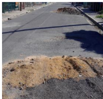
Imagen de la vía obstruida.