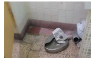
Imagen tomada en uno de los baños del Hospital mencionado, ubicado en la cabecera provincial pinareña.