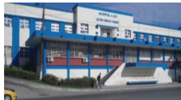
Imagen del Hospital León Cuervo Rubio en Pinar del Río.

Ha disminuido el servicio de salud en nuestro territorio, así lo demuestran la cantidad de quejas existente sobre este tema de la salud, son disímiles las historias de pacientes y acompañantes que han pasado por un calvario en las salas de los enigmáticos hospitales de reconocida fama en todo el país.