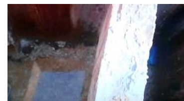
Imagen de un techo colapsado en la zona norte de Pinar del Río.

ralizadas por falta de electricidad y la contaminación por la penetración del mar. En la capital habanera se reportaron 4288 viviendas dañadas, Santiago de las Vegas y el municipio de Boyeros, fueron golpeados por lo vientos de Irma. En Pinar del Río, provincia menos afectada, se produjeron derrumbes de viviendas en zonas costeras, roturas en el sistema electro-energético, entre otras afectaciones.