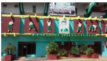
Imagen del estadio principal en Pinar del Río.

des que no aportan nada a la sociedad. A pesar del avance este año del equipo pinareño, existen elementos que atentan contra el desarrollo de la Pelota en Pinar del Río, estamos hablando del factor psicológico, específicamente del apoyo del público y de la misma manera las condiciones creadas a éste cuando asiste a un estadio". Concluyó: Jorge.