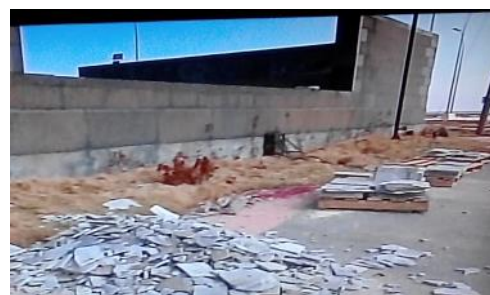
Imagen tomada en el norte de la provincia de Pinar del Río, después del paso de Irma.