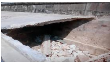
Imagen de una calle destruida por el Huracán.