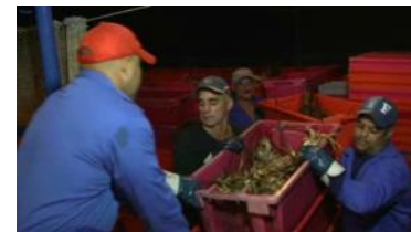
Imagen de trabajadores de la Empresa Pesquera La Coloma, mientras transportaban una caja de langosta, que se destina al turismo.

drían disfrutar los trabajadores pasaría a reservas voluntarias.