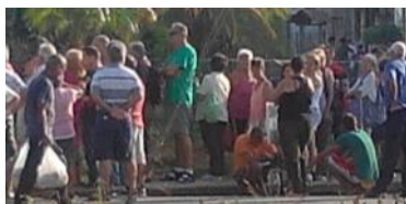
Imagen tomada de la Asamblea de Nominación de Candidatos.

diendo la importancia para el gobierno, no permitirles a estas personas postularse en las asambleas. Según los dirigentes: -no se les permitirá asistir, son elementos pagados por el gobierno de los Estados Unidos, además la mayoría de ellos son terroristas al servicio de agencias extranjera y pagados por ellas-".