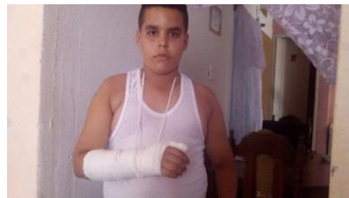
Imagen tomada al niño que sufrió de las ineficiencias del Gobierno en los servicios de Salud que presta a la población.