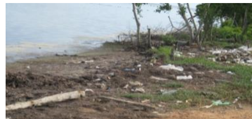
Imagen tomada a la Playa Las Canas.

"Las opciones recreativas preferidas por gran parte de la población cubana, en