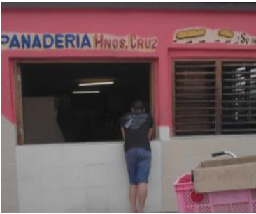
Imagen tomada a la Panadería del pan normado.

Pinar del Río, (ICLEP). El pan es un producto limitado y necesario para la alimentación; el Estado debe garantizar que cada ciudadano cubano pueda adquirir uno por persona al día, según lo estipulado por la cuota permanente durante más de 58 años, desde que fue creada la libreta de abastecimiento y no siempre es así.