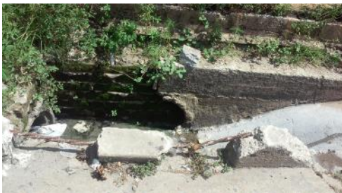
Imagen tomada al hueco que obstaculiza el paso peatonal, poniendo en riesgo de peligrosidad la vida de los transeúntes.

Pinar del Río, (ICLEP). Se torna imperiosa la necesidad de eliminar un hueco en la vía pública que puede provocar un accidente, además de constituir un peligro para la salud humana porque constituye un depósito de aguas contaminadas, putrefacción, fetidez e insectos perjudiciales para la vida de los humanos.