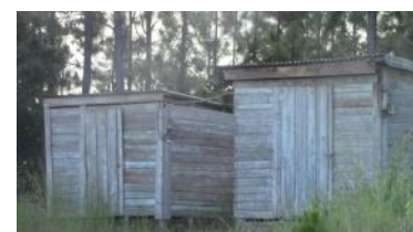
Imagen del caserío antes que les quitaran los metro-contadores.

"Las familias afectadas hemos dirigido las quejas al delegado de la zona, gobierno municipal y a la sede del PCC en el municipio, la respuesta que recibimos es que los recursos destinados sólo cubría la zona de la cooperativa. Hemos hablado directamente con las autoridades para ver si se puede llevar a la práctica un proyecto de paneles solares para las familias que se encuentran más