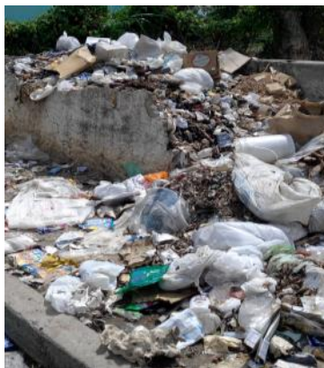
Imagen tomada a uno de los vertederos en zona pública; a más de siete días sin efectuarse la recogida de basura.

Pinar del Río, (ICLEP). La despreocupación de las instituciones gubernamentales y la falta de exigencia a los trabajadores de comunales, ponen en riesgo la salud del pueblo cubano. Los contenedores permanecen llenos de basura y desbordados durante varios días, sin que el carro destinado para ello haga la recogida programada.