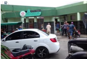
Imagen tomada a la tienda "La Alameda", ubicada en la ciudad cabecera, Pinar del Río.

Pinar del Río, (ICLEP). En las tiendas recaudadoras de divisas, los precios no se equilibran con el salario del pueblo trabajador. El centro comercial "La Alameda", es un lugar donde se expenden productos, no hay proporción entre el valor de los artículos en venta y el poder adquisitivo de los ciudadanos.