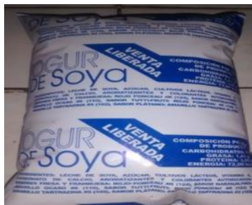
Imagen de una bolsa de Yogur a punto de explotar, media hora después de comprada.

Pinar del Río, (ICLEP). Imperiosa necesidad alimentaria existe en nuestra provincia. Resulta importante la adquisición de las bolsas de yogur de soya, no sólo por su valor nutritivo sino porque realmente existen pocas opciones, sobre todo para los niños y ancianos.