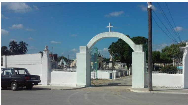
Cementerio Metropolitano, ubicado en el Reparto Cuba Libre, perteneciente a la ciudad cabecera de Pinar del Río. Uno de los cementerios más fluidos y utilizados en la ciudad.

Un directivo de la Empresa de Comunales, que no permitió la publicación de su identificación, expresó a Panorama Pinareño: "Nosotros todos los años garantizamos que se oferte una variedad de flores en las entradas de los Cementerios, este año no ha sido posible, el ciclón Irma no afectó mucho la provincia, pero sí los plantones estatales de flores que se destinan para estos fines, las que hay, se envían para la Funeraria de la provincia". Declaró el directivo de la entidad mencionada.