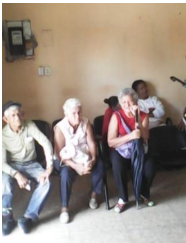
Personas de la tercera edad, con padecimientos crónicos de tratamiento médico permanente; esperan el envío de medicamentos a la Farmacia.