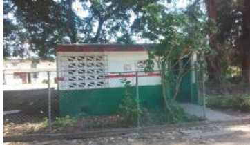
Punto de Venta de Gas Licuado; abierto sin ofrecer servicio.

Pinar del Río, (ICLEP). Hace varios meses se ha estado efectuando la venta liberada de gas licuado (GLP). En diferentes Consejos Populares del municipio cabecera, se realizan los contratos en los puntos de venta habilitados para el servicio. El precio no está acorde a lo que puede pagar la población con los bajos salarios, y las necesidades básicas del pueblo trabajador, generando inconformidad a los usuarios.