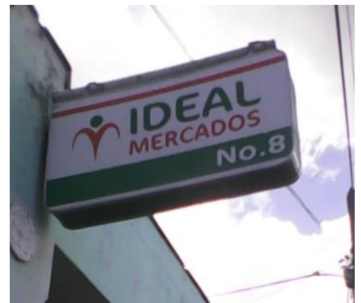
Mercado ideal ubicado en La Alameda, Consejo Popular enclavado en la ciudad cabecera de Pinar del Río.

"Debe existir alguna disposición para evitar que estos casos sucedan. Todo lo que se oferta en los Ideales es necesario, sobre todo para la merienda escolar. Después de una hora en el mostrador, los que estaban delante compraron todo para revenderlo. Los huevos que se ofertan por la canasta básica a un precio de 0.15 centavos en moneda nacional fueron vendidos a un file por cada núcleo familiar, a 1.10 cada huevo, a través de la libreta de abastecimiento; esto se hizo