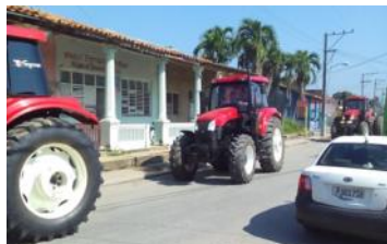
Caravana de Tractores en la provincia de Pinar del Río.

La Dirección Provincial de la Agricultura, recibe equipos destinados a la atención que deben ofrecerle a los campesinos para que mejore el trabajo. Se trata de un clan de tractores que se emplearán en los campos de la provincia, especialmente para cultivos como el tabaco.