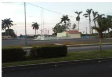
Lugar donde se efectúan las ferias, en este caso, fue sustituida por un acto político, y pospuesta por falta de alimentos en la provincia.

Pinar del Río, (ICLEP). Crítica situación alimentaria enfrenta nuestra provincia, sin ser los más afectados por el Huracán Irma. La conocida Feria que se desarrolla todos los últimos sábados de cada mes, fue evadida el fin de semana correspondiente al día 28 del mes de octubre.