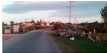
Entrada del poblado La Coloma, pueblo pesquero ubicado en la costa sur de Pinar del Río; a la izquierda de la imagen está erigida la escultura de la langosta.

Pinar del Río, (ICLEP). A la intemperie, desprotegida, oxidada y corroída, debido al salitre ambiental entre otros factores como el maltrato social, está erigida en la entrada del Consejo Popular La Coloma, la escultura metálica de una langosta, representando: la imagen distinguida de la localidad, y al igual que la pesca del bonito, una retribución económica para la región y para el país, con grandes intereses en cualquier moneda.