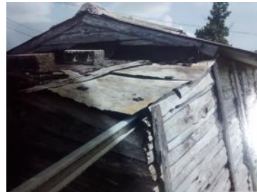
Vivienda en mal estado. Típico escenario en Cuba.

Sin embargo, ya con más de 50 años de este gobierno en el poder, siguen sin resolver los más elementales problemas de la nación. Para citar un ejemplo, quiero señalar el problema de la vivienda que es uno de los tantos que agobian al pueblo cubano.