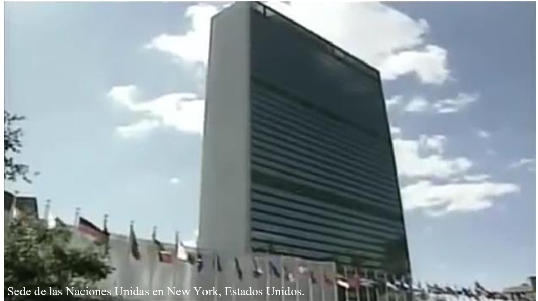
Sede de las Naciones Unidas en New York, Estados Unidos.