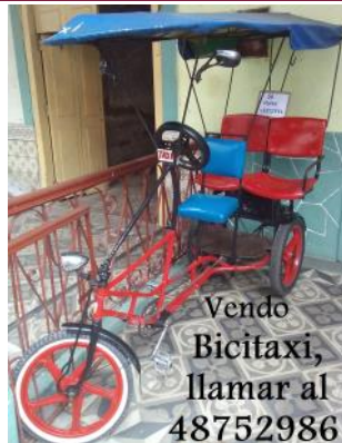
Vendo Bicitaxi, llamar al 48752986