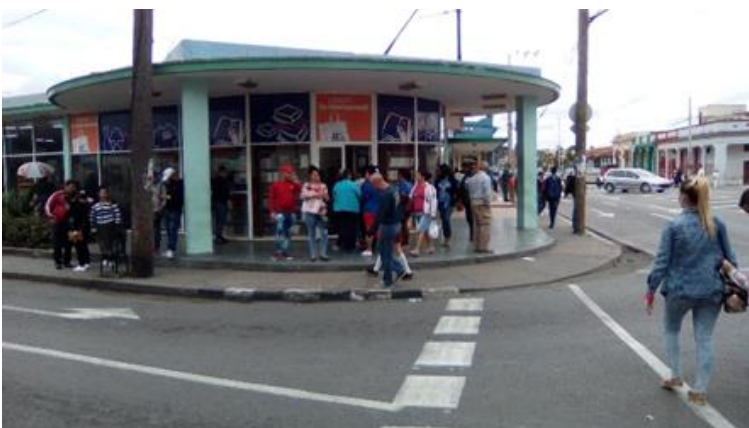
Tienda en el centro de la ciudad donde se venden juguetes caros, para niños..

De nada vale negar las desigualdades sociales que existen en Cuba, donde nuestros niños sufren las consecuencias emanadas de las necesidades económicas que acaben sobre sus padres. No todos los infantes disfrutan de iguales condiciones de vida, dependiendo siempre del estatus social de la familia. Se les priva de la fantasía propia de su infancia, no pueden cultivar el amor a los Reyes Magos dejando volar su imaginación. Queremos que tengan su día de fiesta pero el gobierno no garantiza las posibilidades. Por lo que: una vez más se demuestra que existen en Cuba "príncipes enanos sin fiestas" .