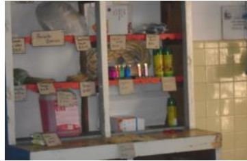
Establecimiento estatal donde venden fósforos.

foreras es pésima, se puede utilizar pocas veces, luego hay que botarlas porque ni arreglo tienen, la vida de los cubanos es triste, el sistema exhibe una imagen muy distinta a la realidad, es la pacotilla más barata comparada con los mercados internacionales", concluyó. Por otra parte, una empleada de Comercio, quien no quiso dar su nombre, expresó: "El proble-