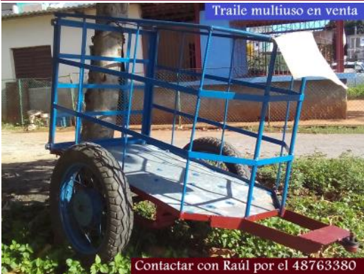
Contatar con Raúl por el 48763380