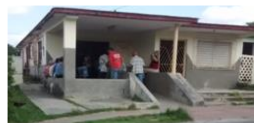
Farmacia ubicada en el Reparto.

de 13 años también necesita las almohadillas, es una renta conseguirlas por otra vía, que no sea en la farmacia, el algodón sólo es asignado a los diabéticos".