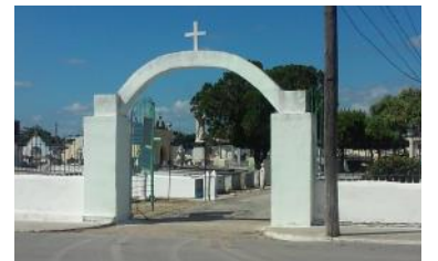
Cementerio Metropolitano de Pinar del Río.

Hechos como estos son parte de la indisciplina social que caracterizan a nuestra nación,