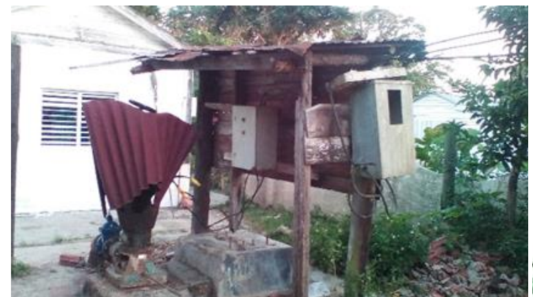
Motor utilizado para el regadío de agua para posteriormente enviarla a los sembrados de tabaco.

Las empresas estatales encargadas de garantizarles los insumos he implementos de trabajo a los campesinos, incumplen los contratos y no existe una vía legal para poder realizar una demanda como está establecido en cualquier parte del mundo. Olvidan que los campesinos cultivan la tierra y de su ganancia es que viven y alimentan a la familia.