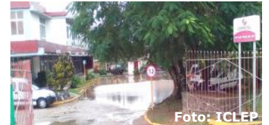
Empresa COPEXTEL, rodeada de aguas estancadas afectando a la población.