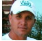
Por: Rolando Pupo Periodista ciudadano

de la pirámide invertida donde los ciudadanos le rinden explicaciones al aparato gubernamental, en vez de ser el gobierno quien rinda explicaciones a la ciudadanía y a su sociedad civil.