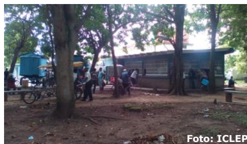
Parque El Bosque, en Calle Galeano.

Ubicado en calle Galeano en el Parque El Bosque, lugar frecuentado por grandes cantidades de clientes al existir un contenedor donde se vende por moneda CUC, y una pipa de cerveza permanente, da un aspecto desagradable que afea el entorno y proporciona peligro para la salud, se encuentran basureros desbordados que alojan en su interior insectos y roedores que pueden propiciar graves enfermedades.