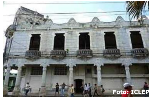
Emblemático Hotel Comercio enclavado en el centro del casco urbano, hoy en ruinas por falta de gestión de los Órganos de Administración Pública de la provincia. Otra de las edificaciones destruidas en la ciudad pinareñas.